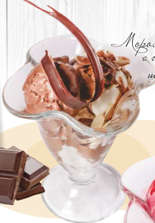
Мороженое с горячим шоколадом