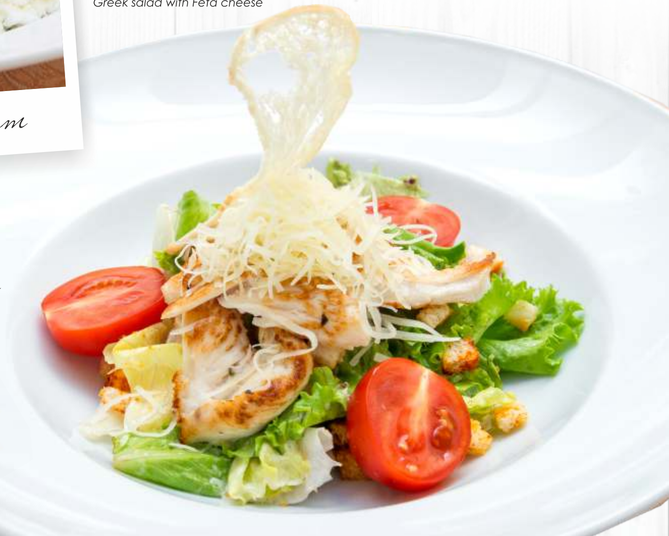
Цезарь с курицей