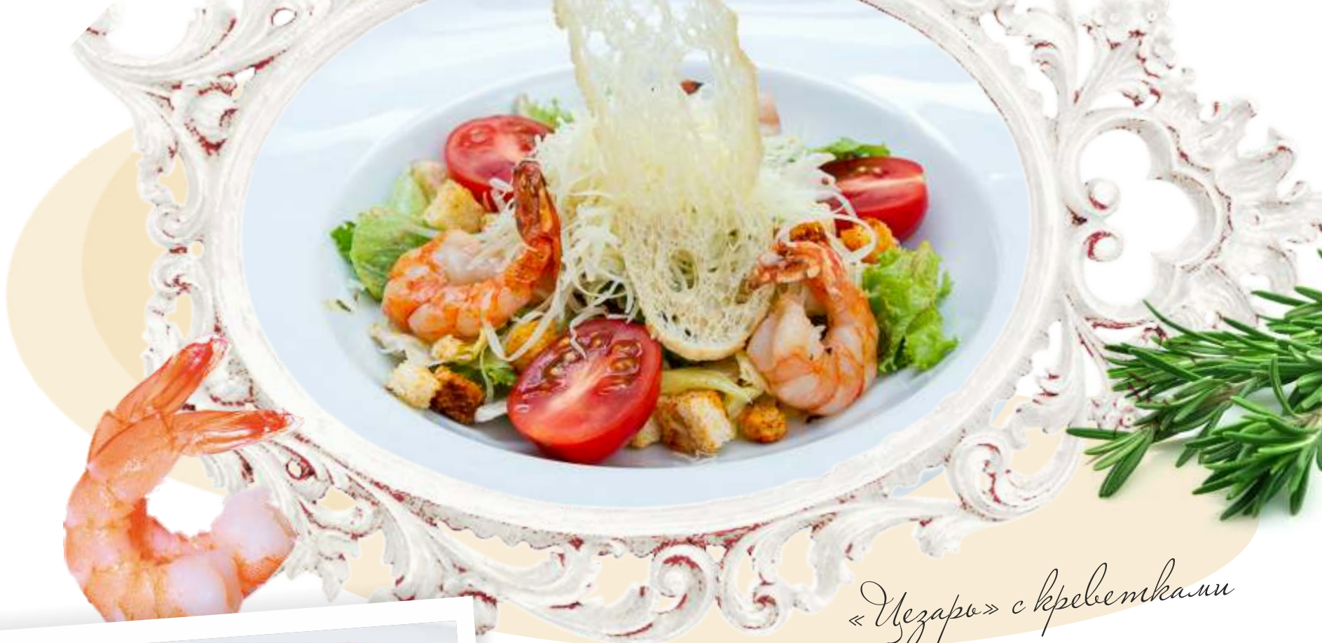
«Цезарь» с креветками