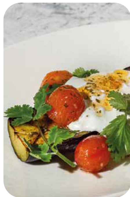
Запеченный баклажан с муссом из феты и маринованными томатами черри 180 г 390 р