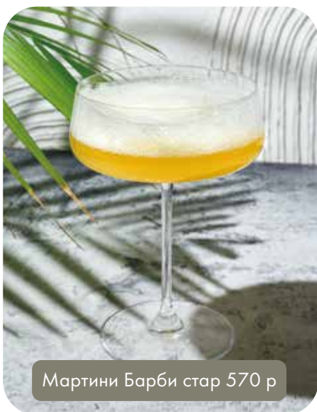
Мартини Барби стар 570 р