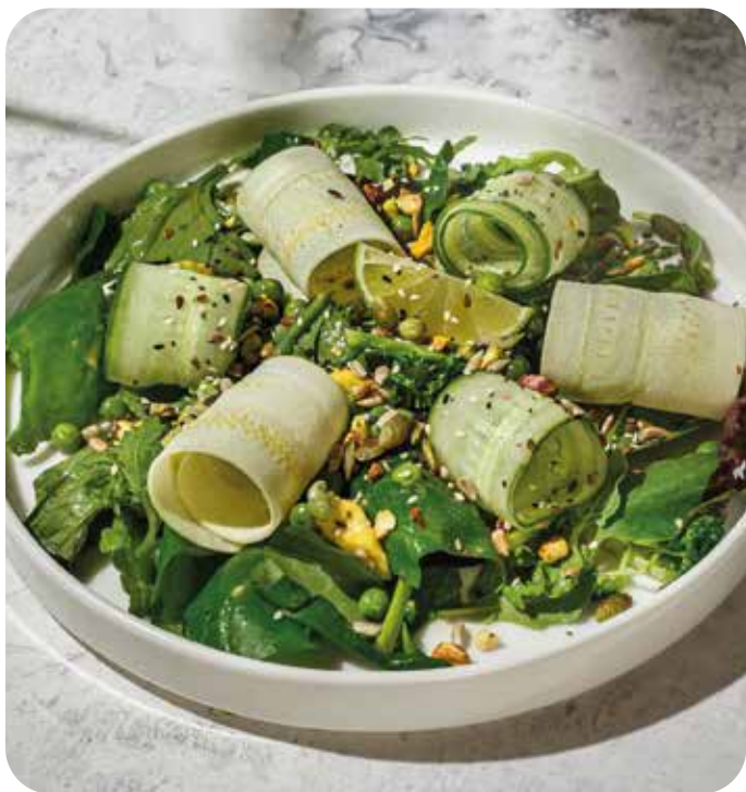
Большой зеленый салат с авокадо, шпинатом, брокколи, цукини, огурцами, горошком и ореховой заправкой 220 г 690 р