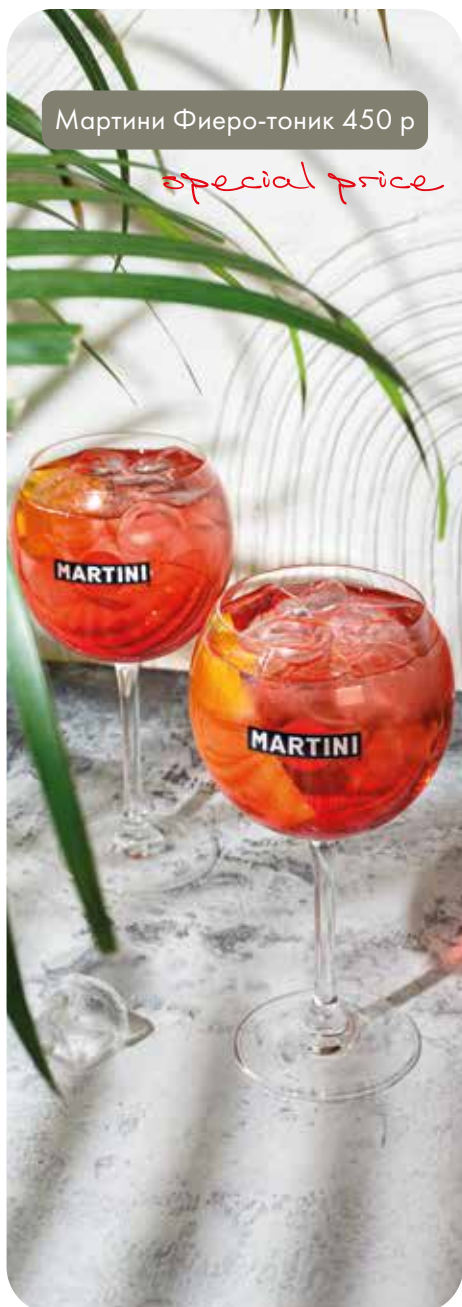
Мартини Фиеро-тоник 450 р