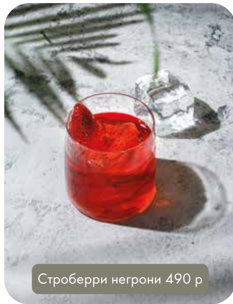
Стробиерри негрони 490 р