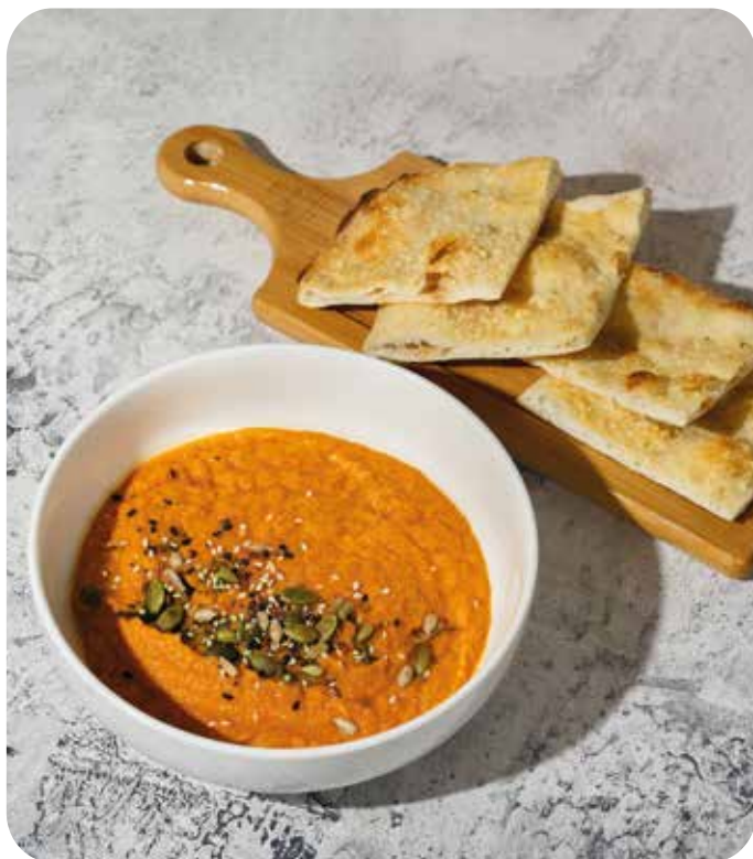
Кабачковая икра с миксом семян и фоккачей 340 г 390 р