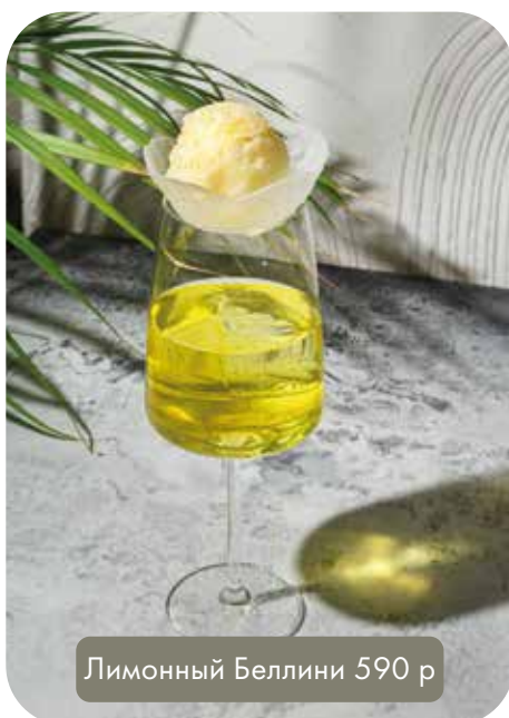
Лимонный Беллини 590 р