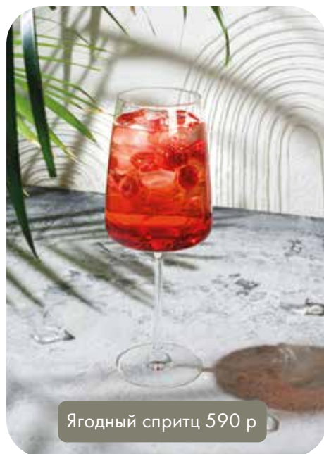
Ягодный спритц 590 р