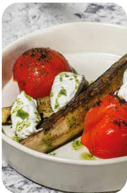
Овощи-гриль с молодым сыром и соусом песто 250 г 470 р