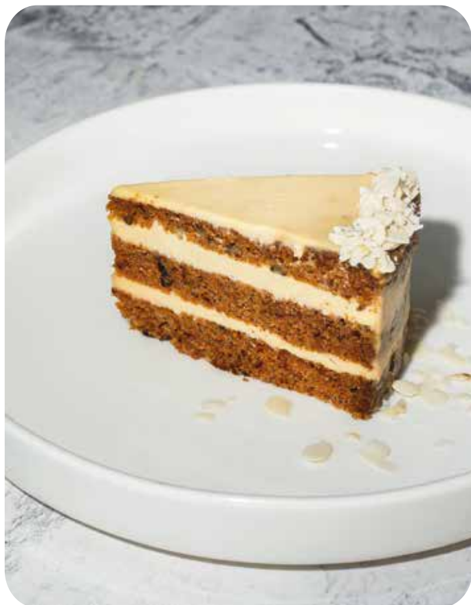
Морковный торт с мороженым манго-маракуйя 200 г 430 р