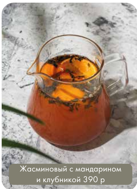
Жасминовый с мандарином и клубникой 390 р