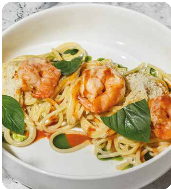
Паста с креветками и соусом перечный чимичурри 290 г 650 р