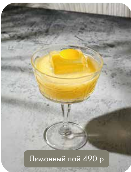
Лимонный пай 490 р