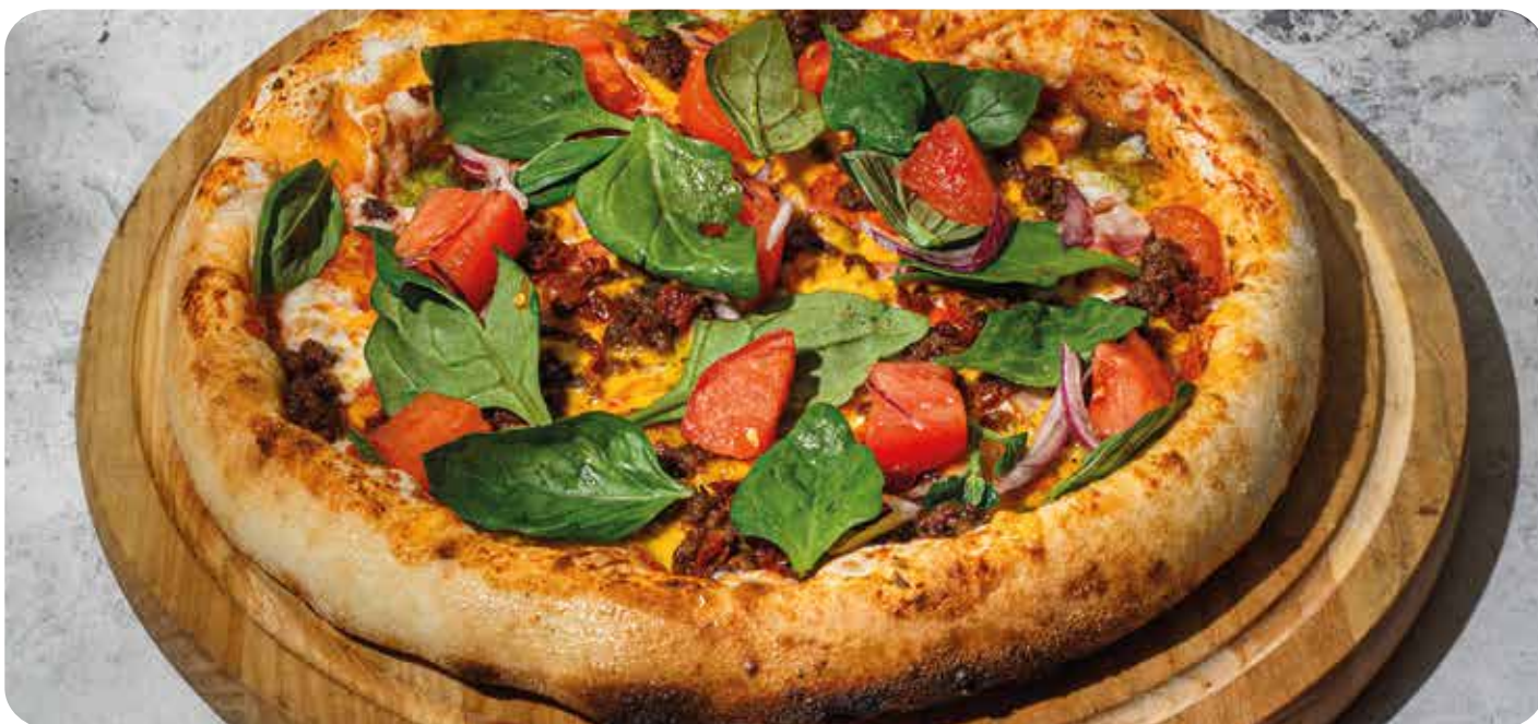
Пицца Мясная ..... 32 см 850 р

Пиццу на пышном тесте с леопардовой корочкой мы готовим в традиционной дровяной печи. Не забудьте заказать соус для бортиков, ведь наши пиццы настолько вкусные, что невозможно остановиться и оставить на тарелке даже маленький кусочек.