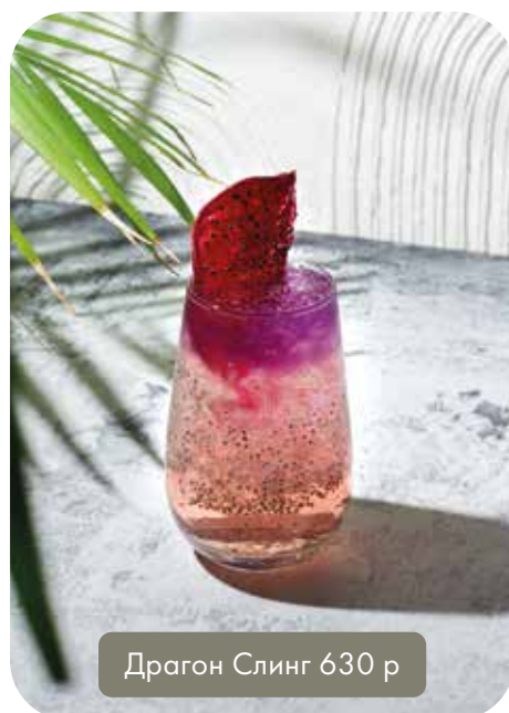
Драгон Слинг 630 р