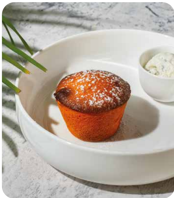
Морковный фондан с мороженым дорблю