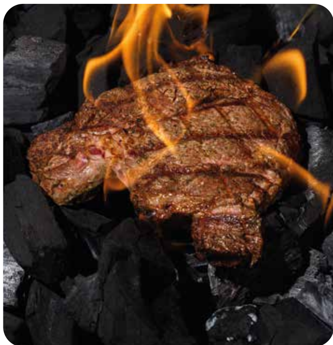
Стейк Рибай 100 г 970 р