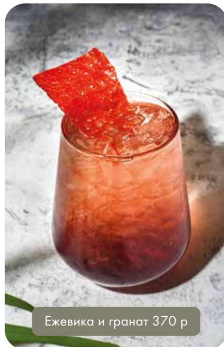
Ежевика и гранат 370 р