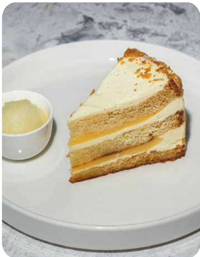
Лимонный торт с сорбе 200 г 520 р