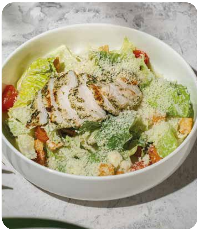
Цезарь с курицей 170 г 550 р