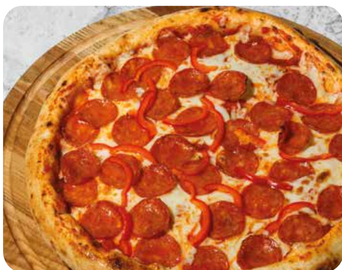
Пицца Пепперони 32 см 690 р