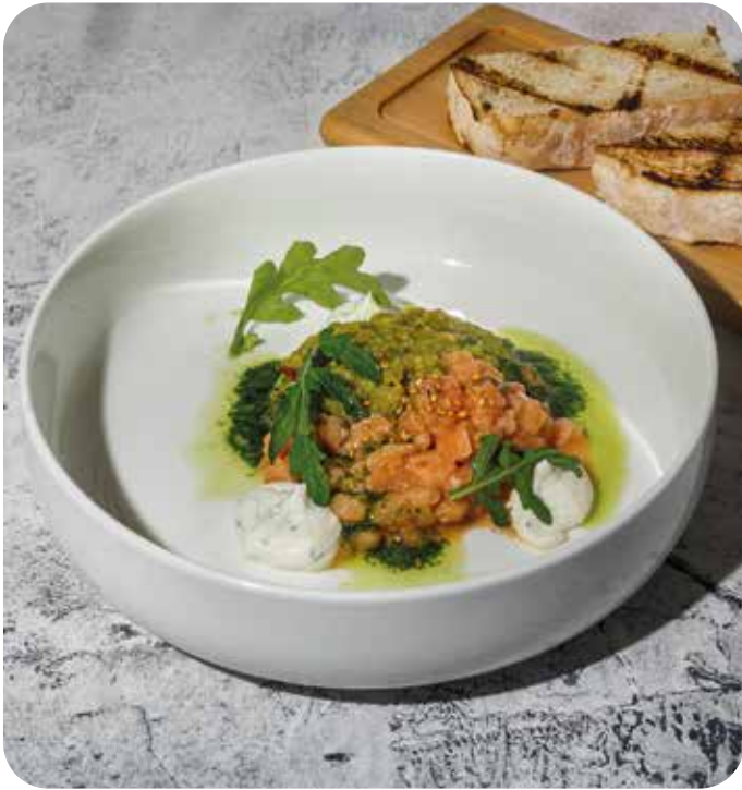
Тартар из лосося с авокадо в соусе понзу и хрустящей чиабаттой 190 г 890 р