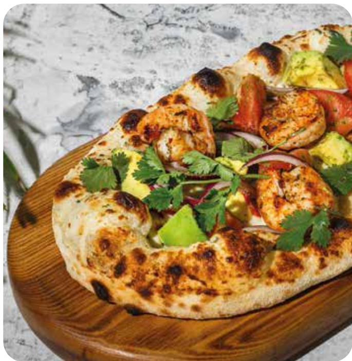
Брускетта с креветками на гриле, томатами, кинзой, авокадо, перцем чили и красным луком 330 г 690 р