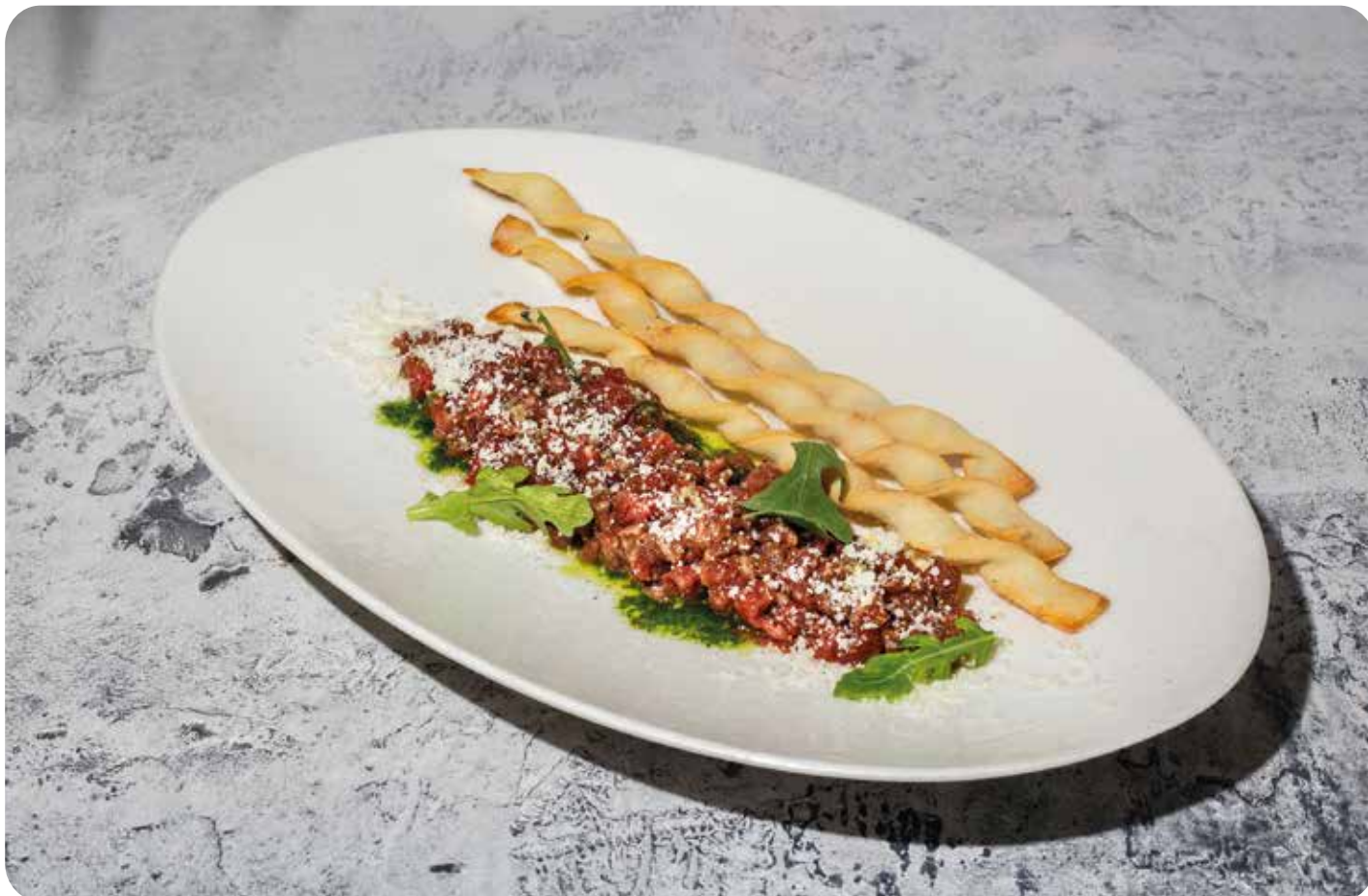
Тартар из говядины пиканья в трюфельной заправке, ..... 100 г 690 р с соусом песто, сыром грана падано и гриссини