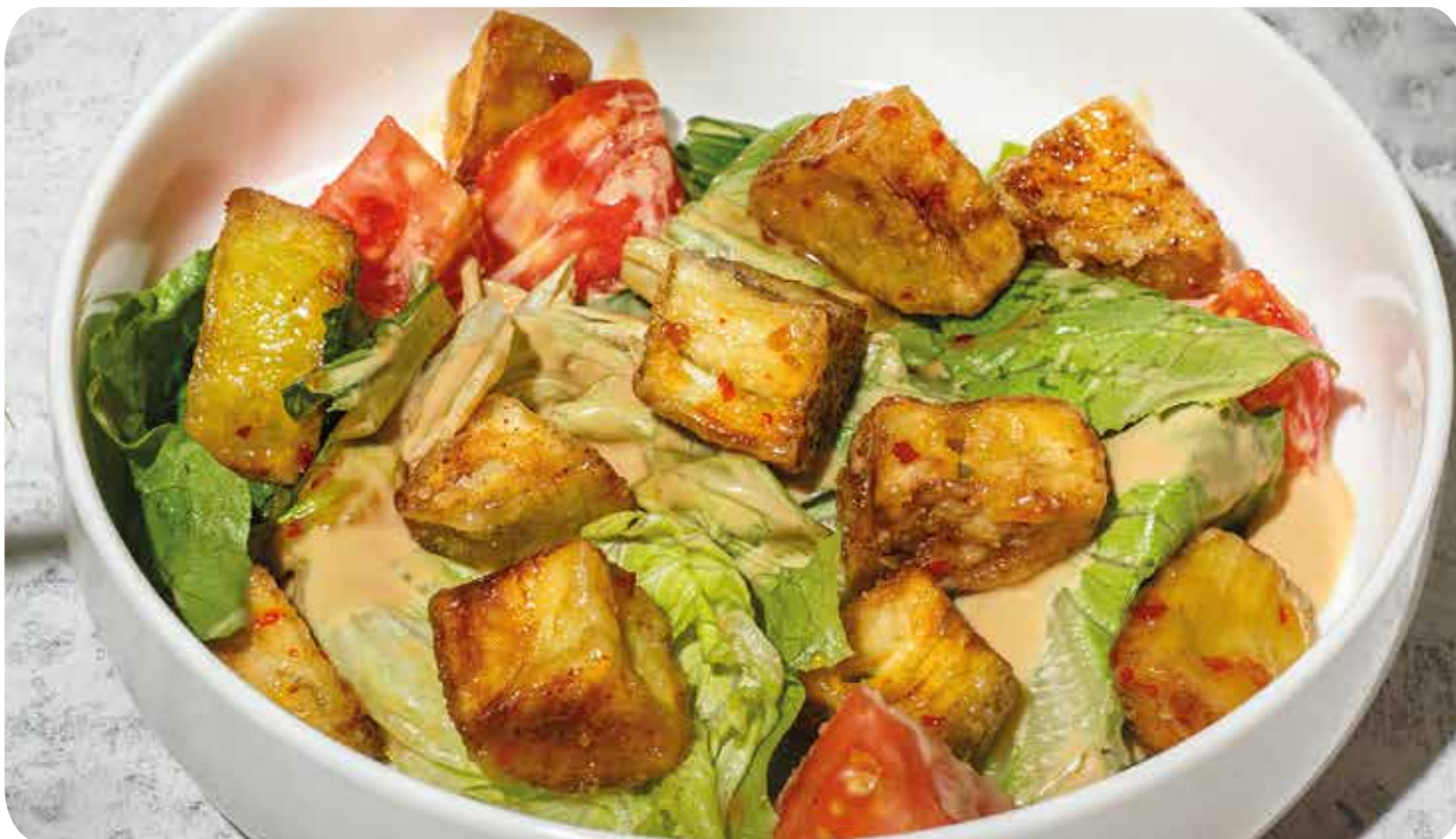
Салат с хрустящим баклажаном, томатами ..... 200 г 530 р и соусом сливочный унаги