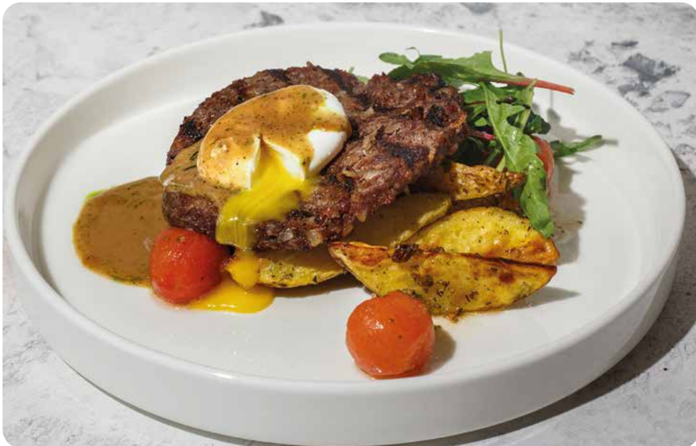
Бифштекс с яйцом пашот, перечным соусом ..... 270 г 790 р и картофельными дольками