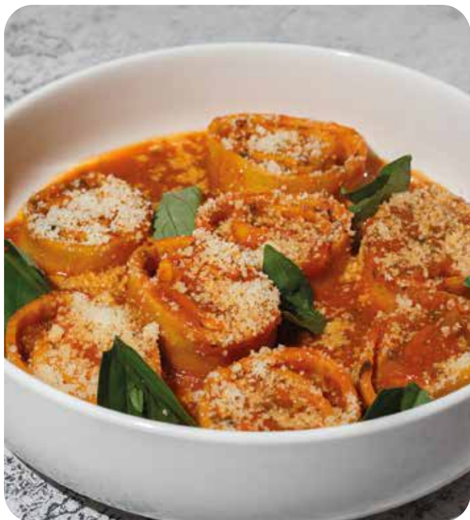
Авторская лазанья с соусом болоньезе 270 г 630 р