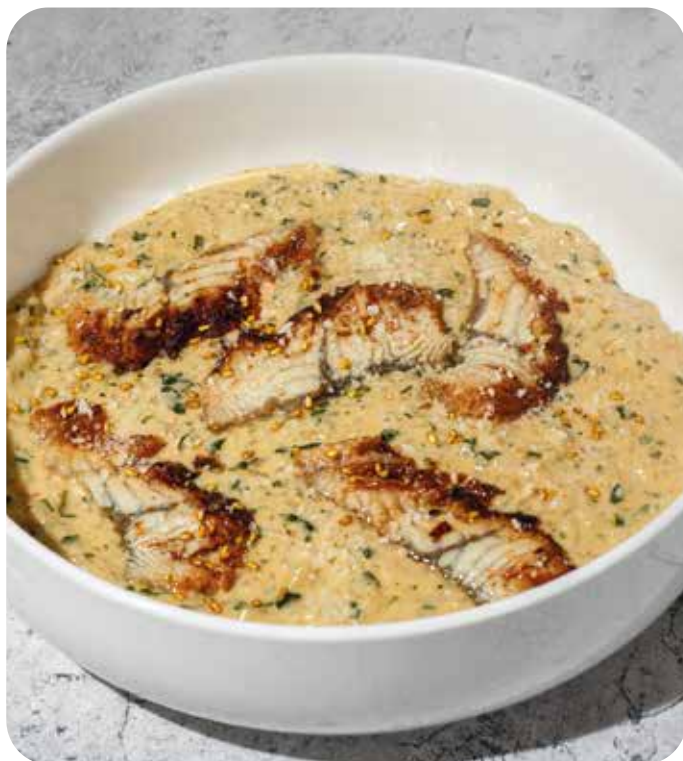
Ризотто с угрем