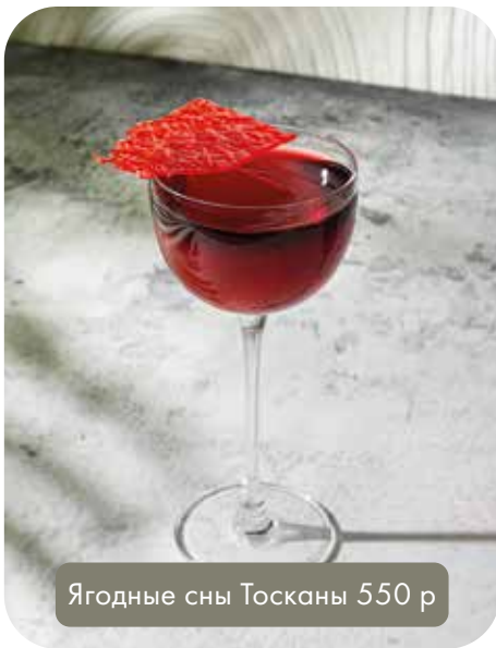
Ягодные сны Тосканы 550 р