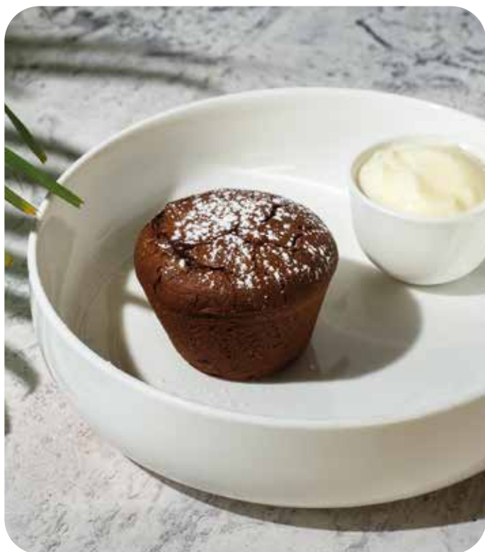
Шоколадный фондан с ванильным мороженым