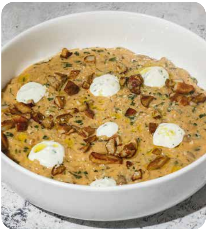
Ризотто с грибами