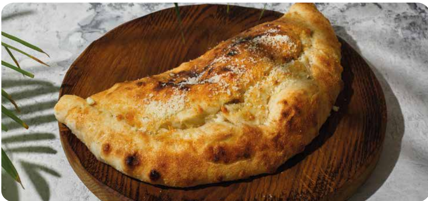
Пицца Кальцоне с чоризо ..... 400 г 730 р