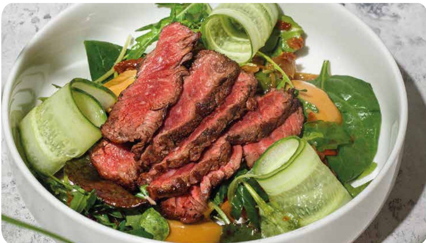
Салат со стейком из говядины, печеными овощами, ..... 220 г 890 р миксом салата и устричным дрессингом