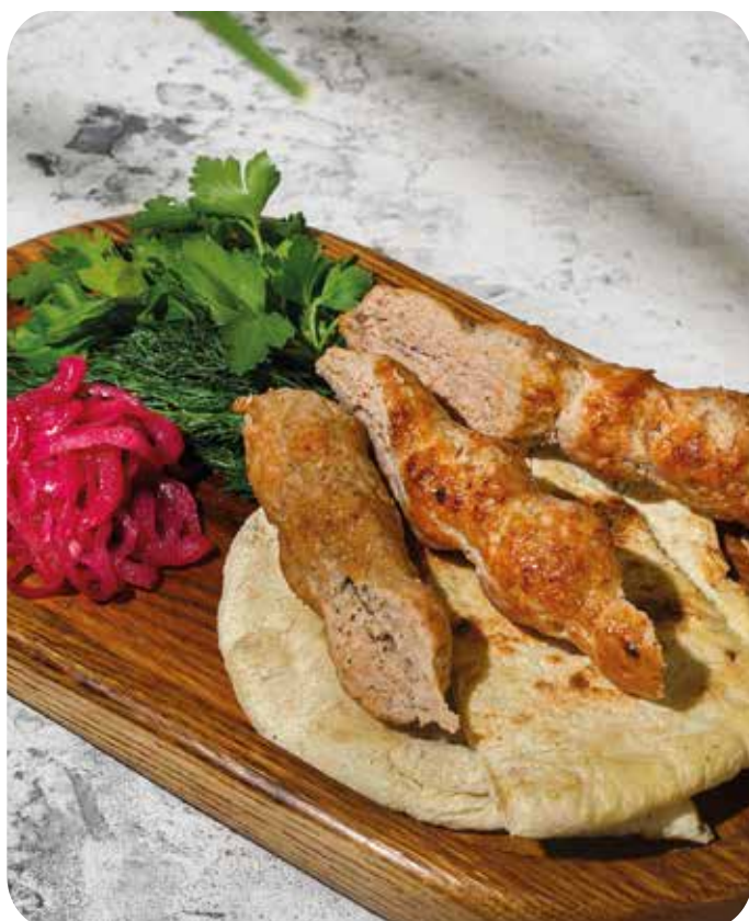
Люля-кебаб из курицы с маринованным луком, зеленью