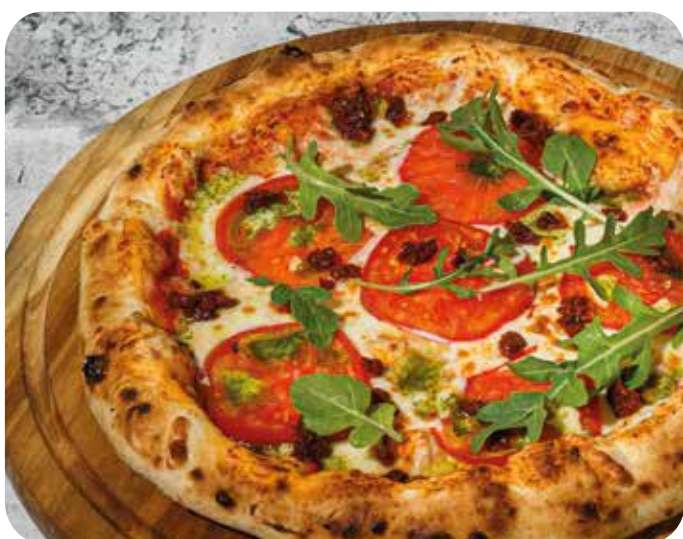
Пицца Маргарита 32 см 650 р