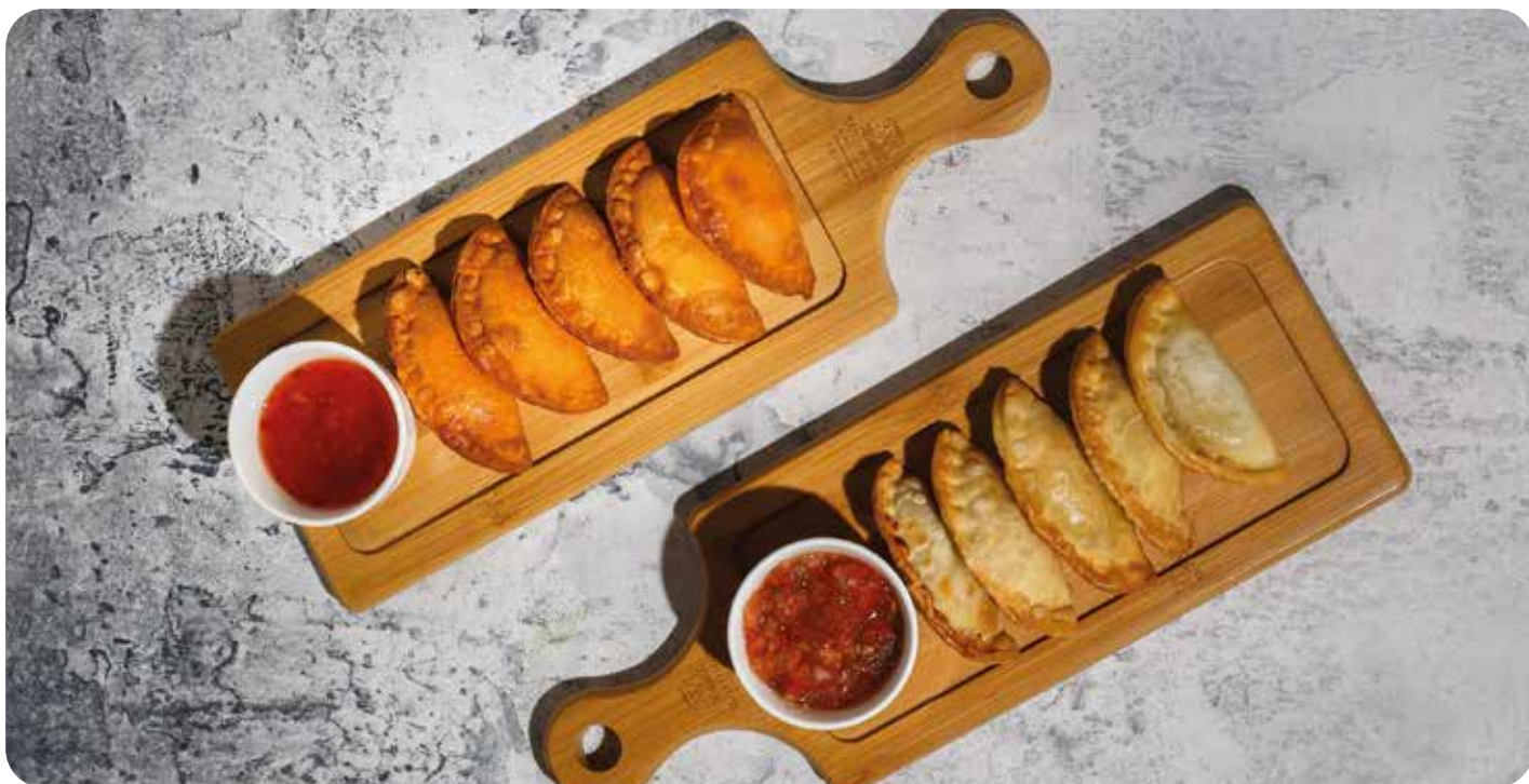
Мини-чебуреки с креветками и соусом сладкий чили 160 г 420 р