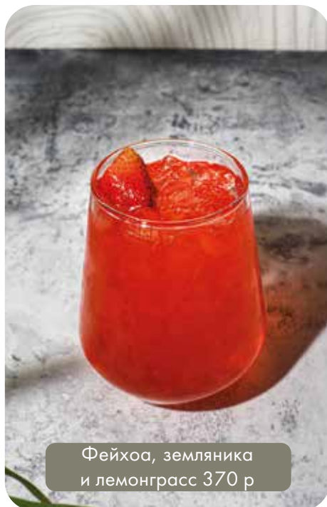
Фейхоа, земляника и лемонграсс 370 р