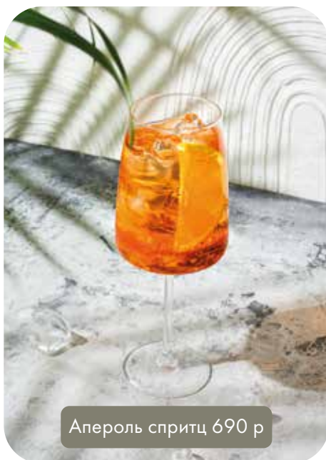
Апероль спритц 690 р