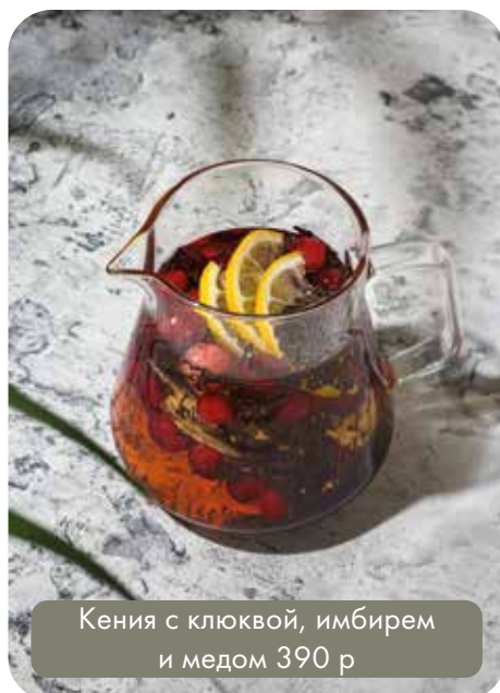
Кения с клюквой, имбирем и медом 390 р