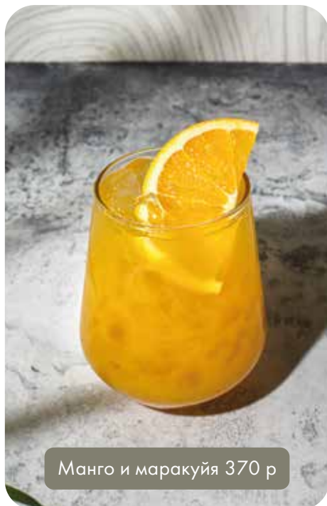
Манго и маракуйя 370 р