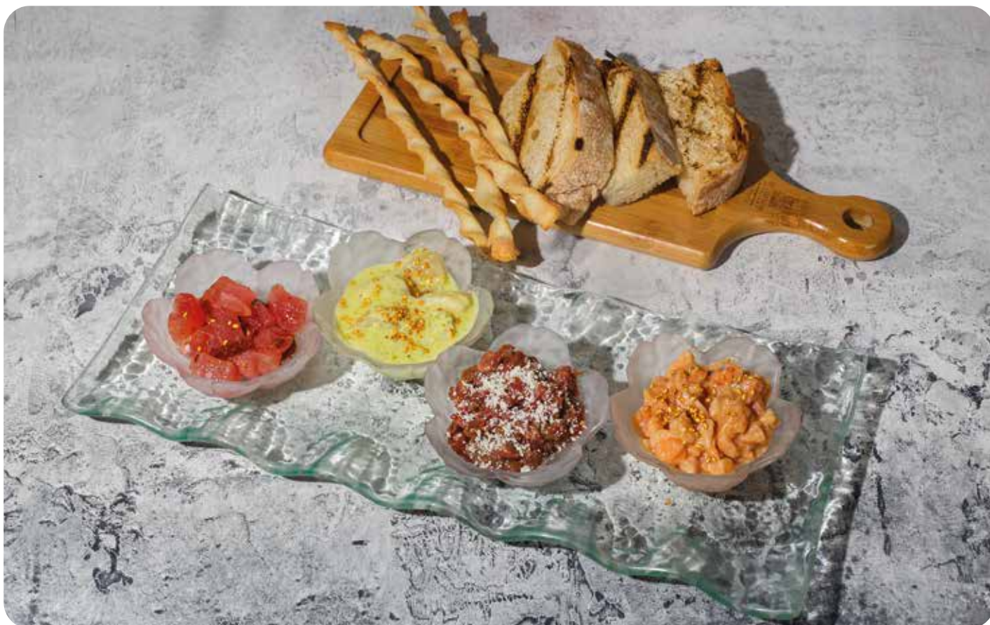
RAW сет ..... 210 г 1150 р (севиче из тунца, севиче из гребешка, тартар из говядины, тартар из лосося)