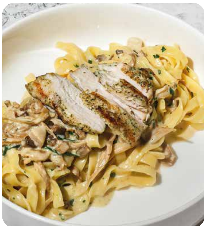
Паста с грибным рагу и куриным филе на гриле 330 г 620 р