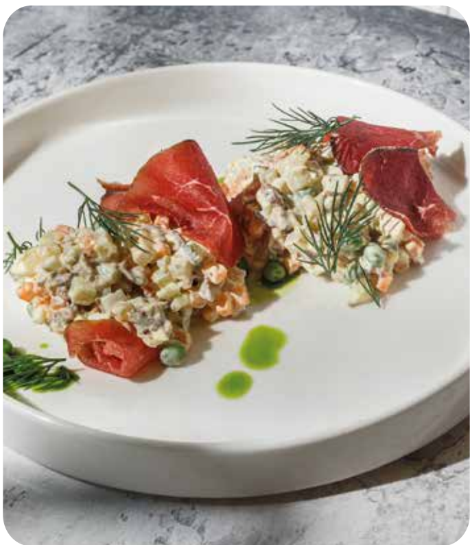
Оливье с говядиной 250 г 590 р