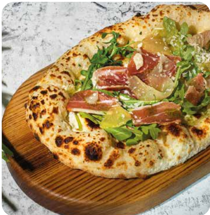
Брускетта с хамоном, руколой, маринованной грушей и пармезаном 240 г 620 р