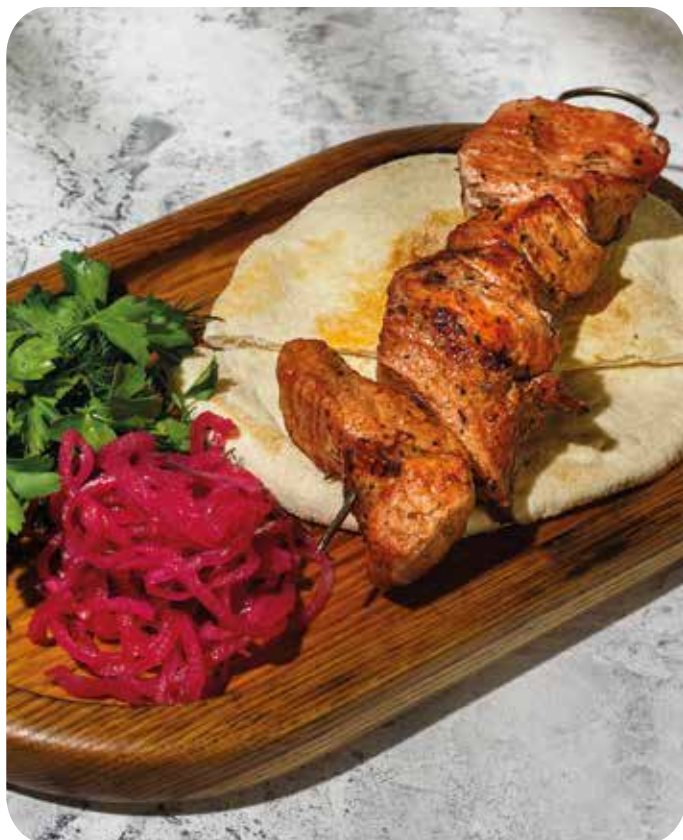
Шашлык из свиной шеи с маринованным луком, зеленью