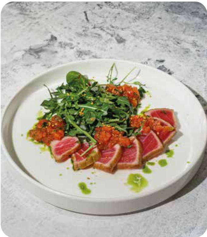
Тальята из тунца с соусом вьерж 160 г 790 р