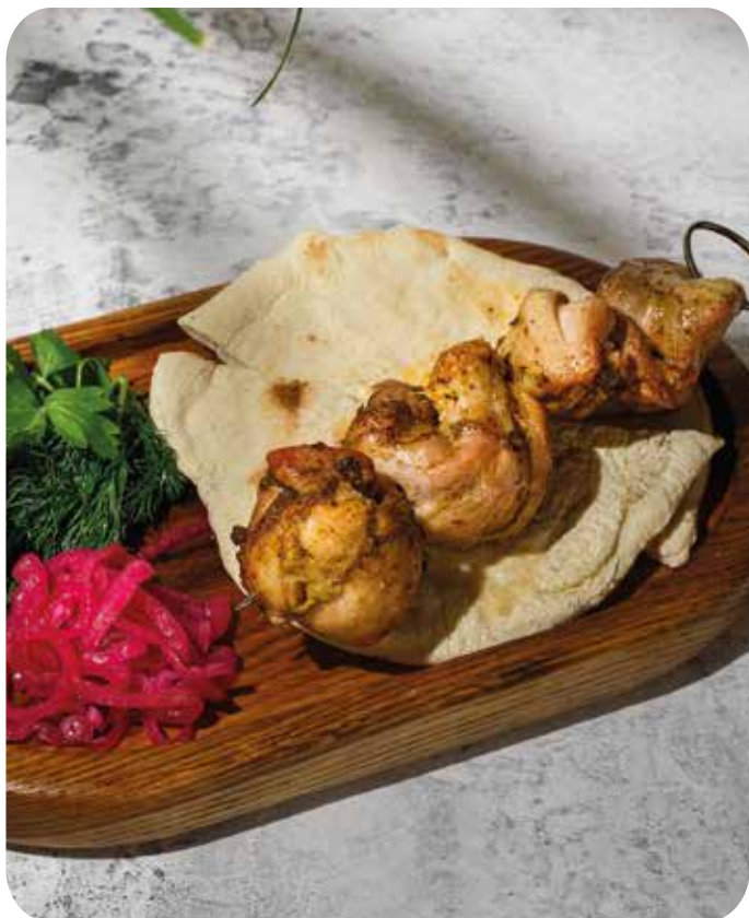
Шашлык из куриного бедра с маринованным луком, зеленью