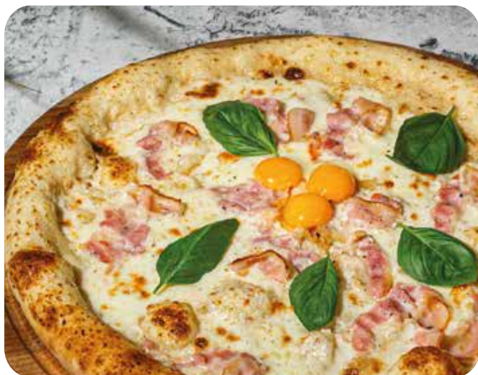
Пицца Карбонара с перепелиным яйцом 32 см 730 р