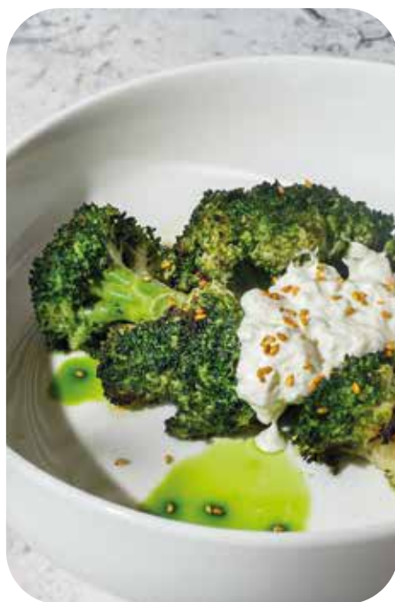
Брокколи с сыром страчателла 150 г 470 р