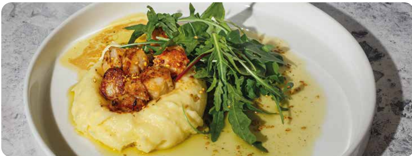
Гребешки с пармезановым пюре ..... 200 г 1250 р