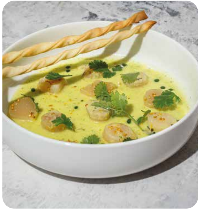
Севиче из гребешка в огуречно-цитрусовом дрессинге с гриссини 130 г 930 р