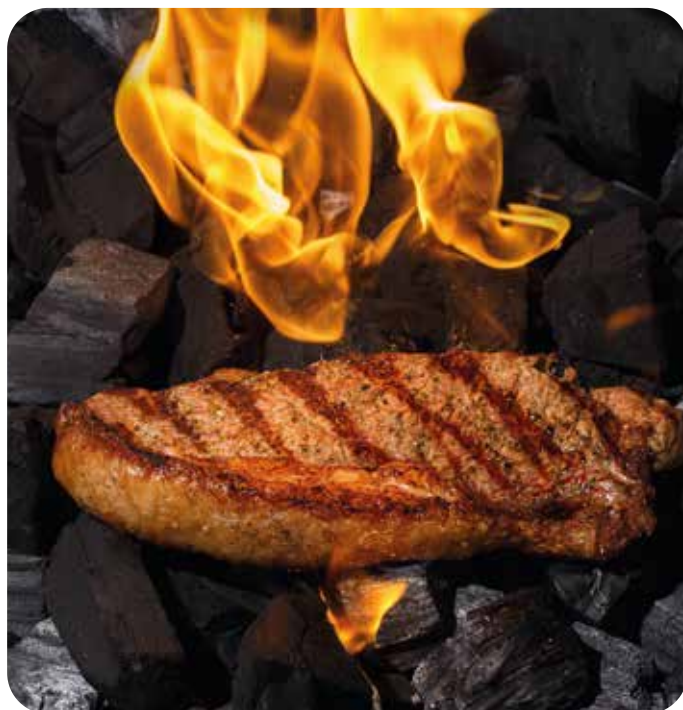
Стейк Стриплойн 100 г 690 р