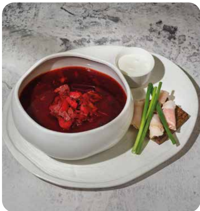
Борщ с говяжьей грудинкой, зеленым луком, сметаной и копченым салом на бородинском хлебе 420 г 590 р