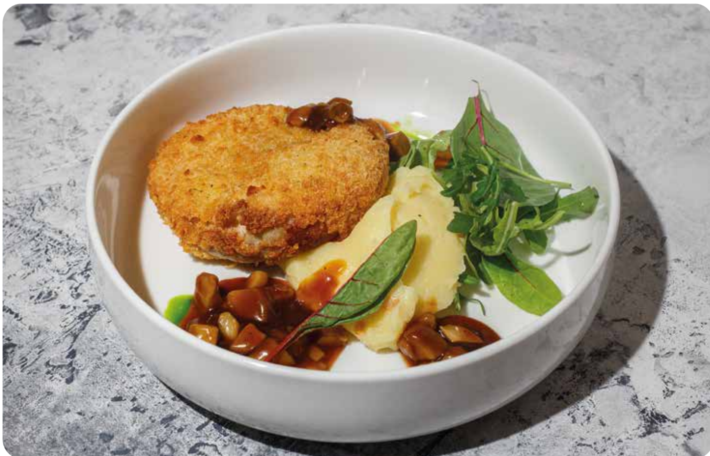
Большая куриная котлета с картофельным пюре ..... 310 г 650 р