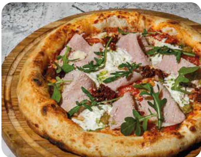
Пицца с ветчиной, руколой и сыром страчателла 32 см 890 р