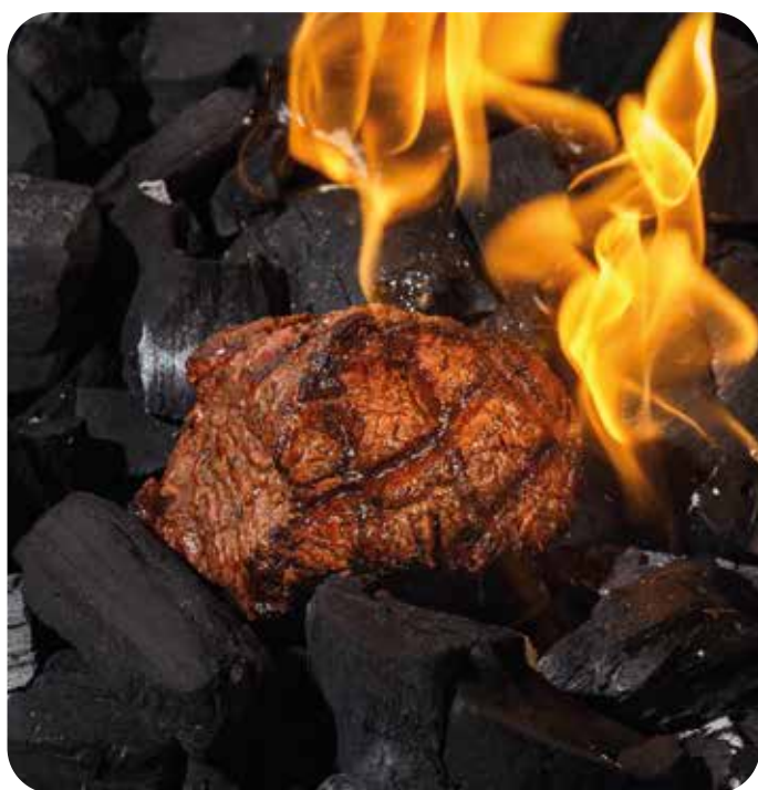
Стейк Филе Миньон 100 г 1390 р

Речная форель с брокколи и соусом пиль-пиль 290 г 990 р