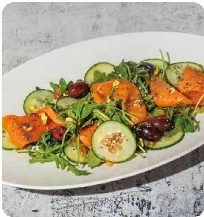
Итальянский салат со слабосоленым лососем, авокадо, оливками и фисташками 200 г 950 р