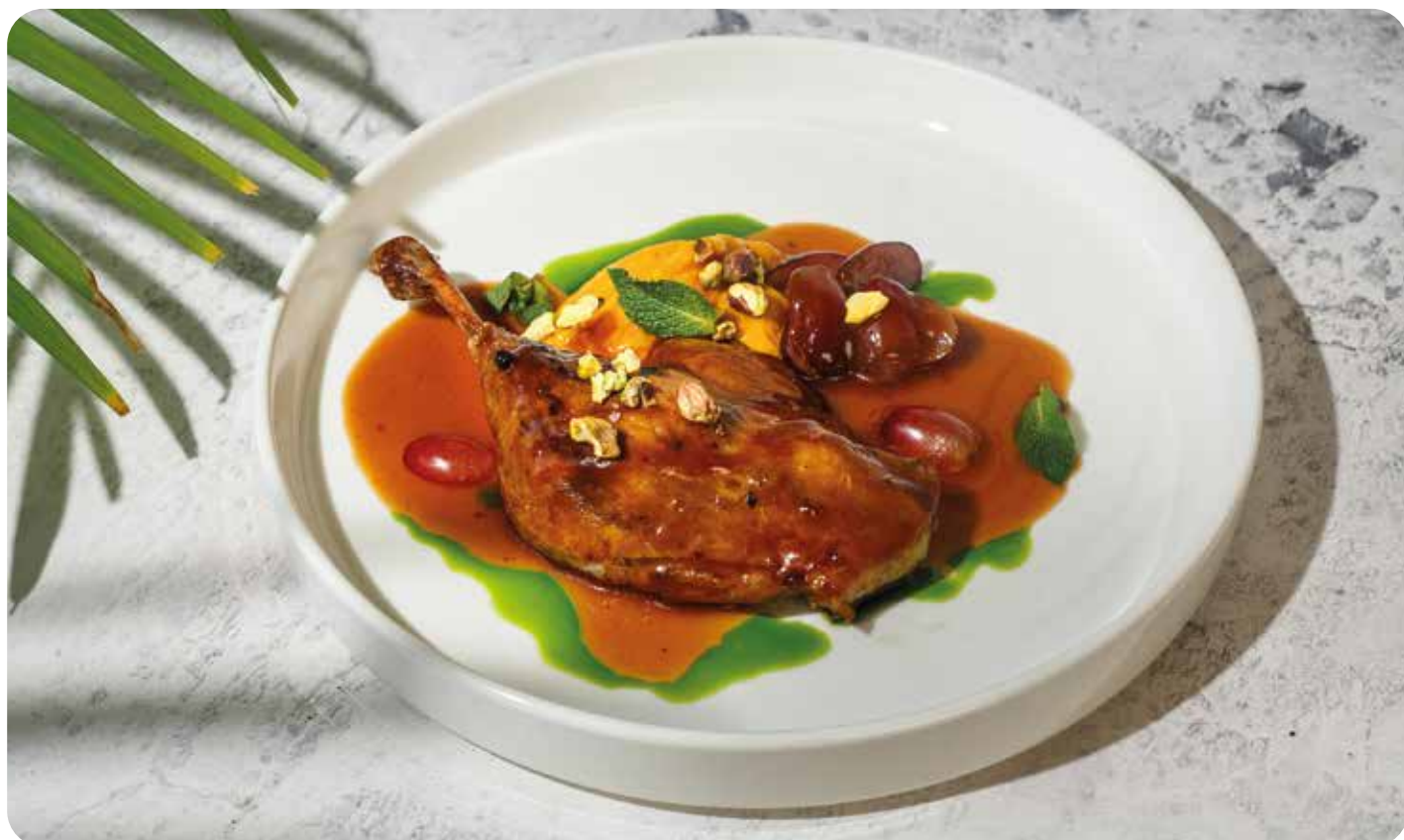
Утиная ножка с тыквенным кремом и виноградом ..... 260 г 930 р