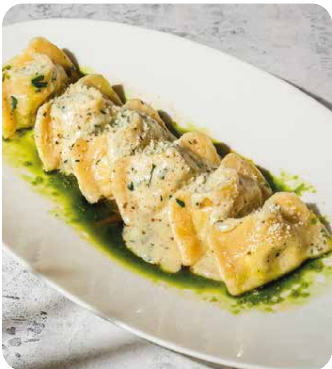
Равиоли со шпинатом

Все пасты подаются с выдержанным пармезаном.