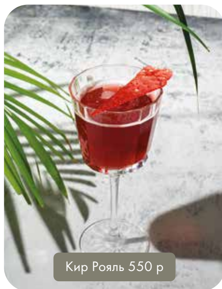
Кир Рояль 550 р