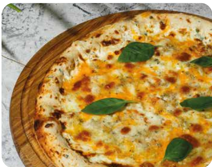
Пицца Сырная с трюфельным маслом 32 см 670 р