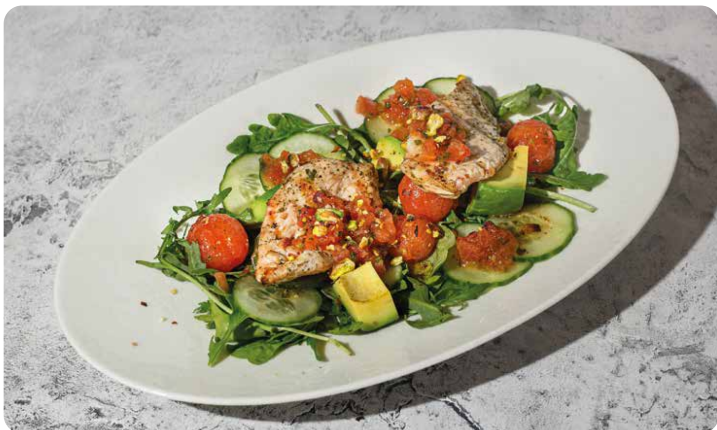
Куриное филе с салатом из авокадо, огурца ..... 250 г 630 р и маринованных черри с соусом вьерж