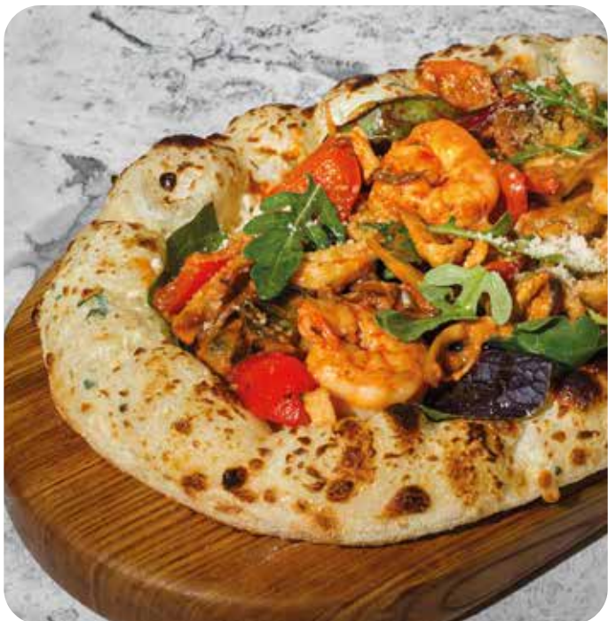
Брускетта с морепродуктами 400 г 890 р