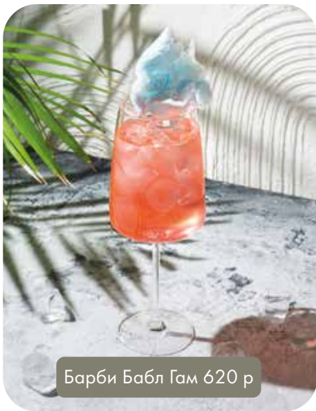
Барби Бабл Гам 620 р