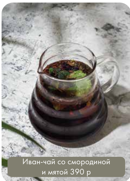
Иван-чай со смородиной и мятой 390 р