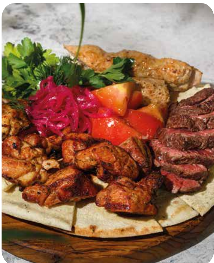
Мясная доска на огне (люля-кебаб из курицы, шашлык из курицы, шашлык из свинины, стейк мясника, фокачча, маринованный лук, кинза)