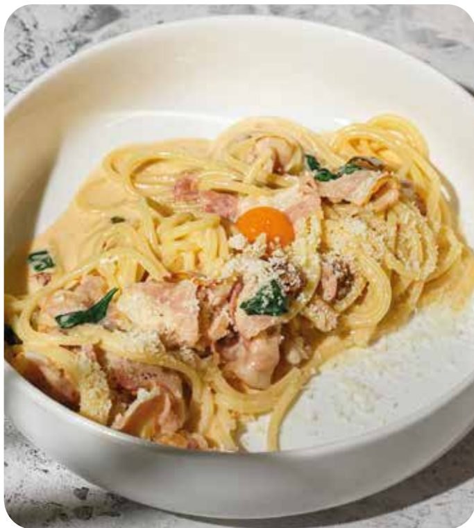
Паста карбонара с беконом