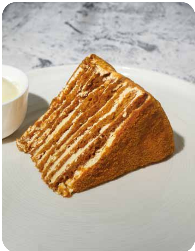
Медово-сметанный торт с ванильным мороженым 180 г 390 р