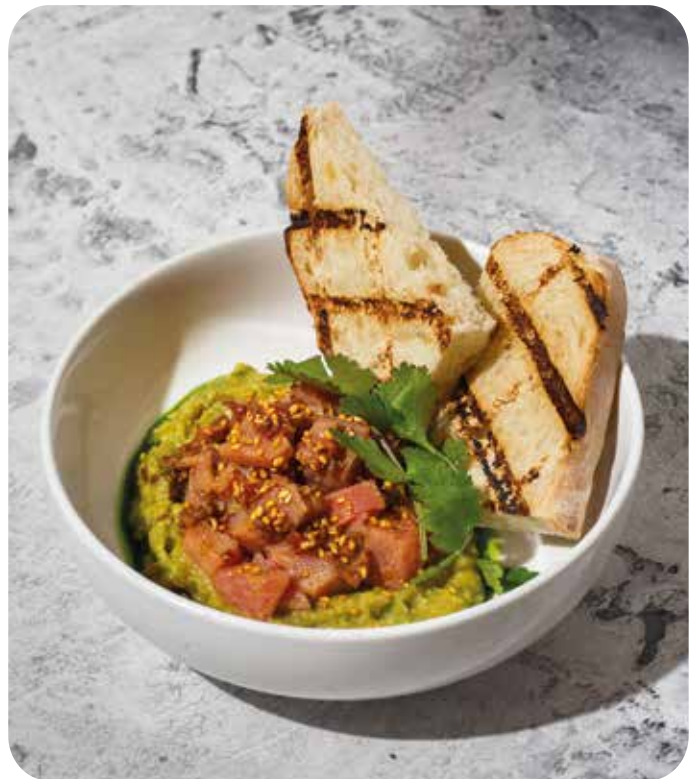
Севиче из тунца с гуакомоле 170 г 670 р