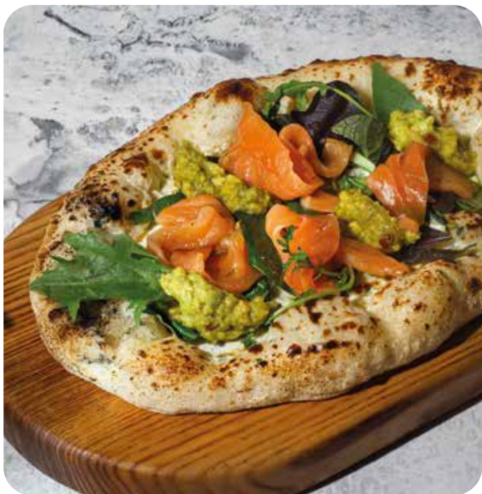
Брускетта со слабосоленым лососем, мятым авокадо и вялеными томатами 260 г 790 р