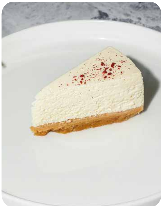
Чизкейк Нью-Йорк 170 г 390 р