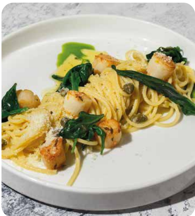
Паста с гребешками и каперсами 240 г 1190 р