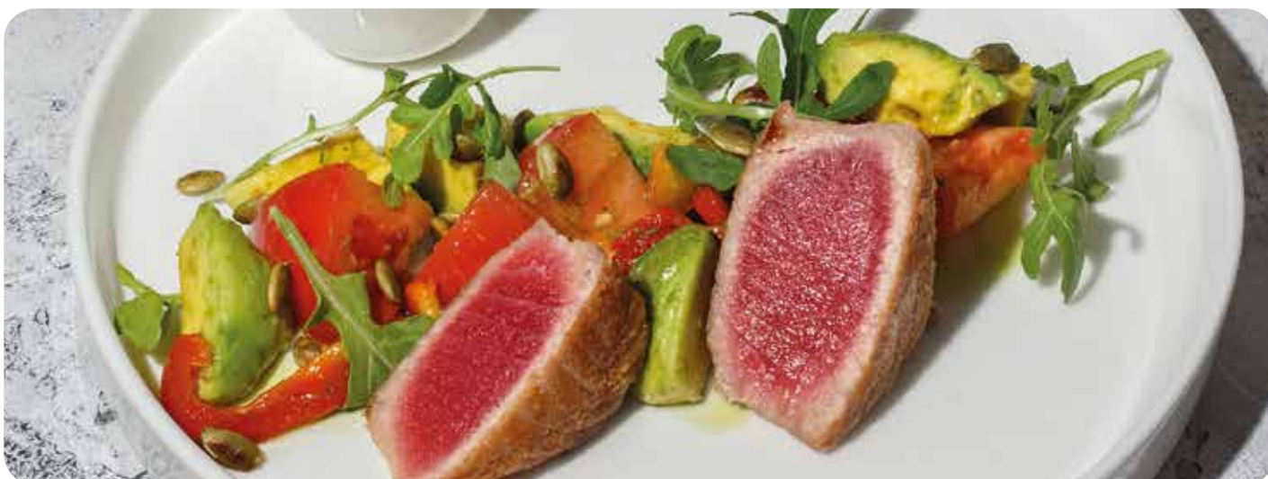
Стейк из тунца с салатом из авокадо, томатов ..... 280 г 970 р и печеных перцев