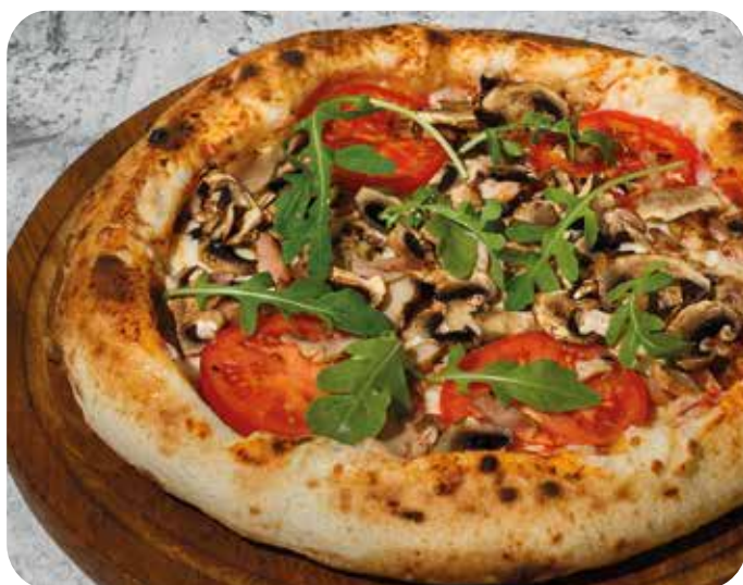
Пицца с Цыпленком и грибами 32 см 750 р