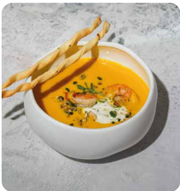
Тыквенный суп с креветками 330 г 630 р