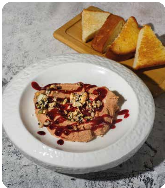
Паштет из куриной печени с бриошью и брусничным соусом 180 г 420 р