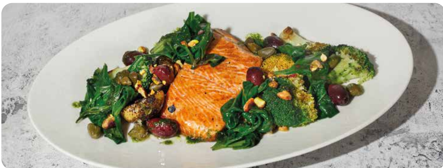
Стейк форели с зеленым гарниром и картофелем ..... 340 г 1750 р