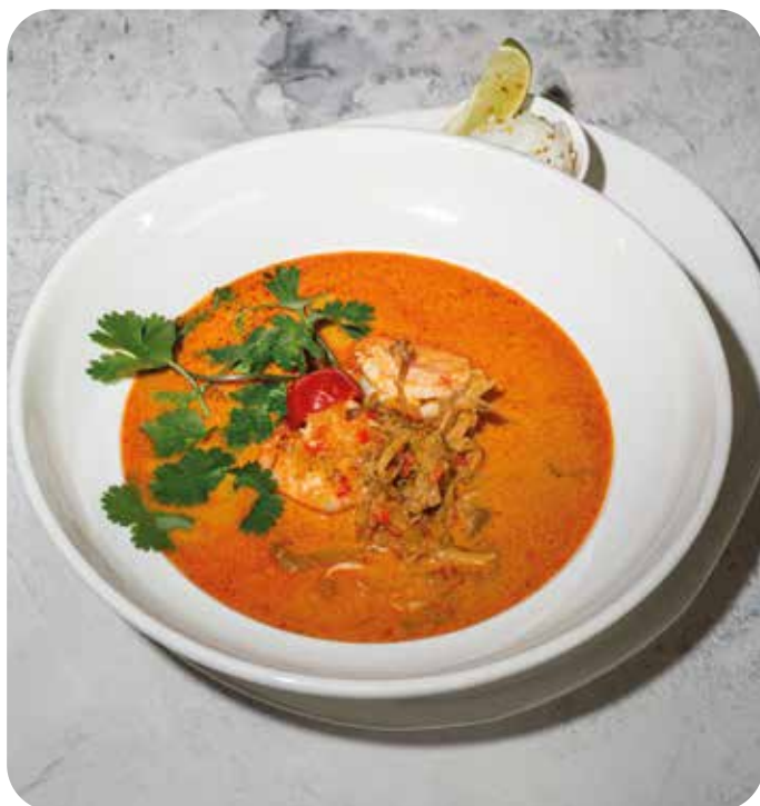
Том-Ям с тигровыми креветками, мидиями и кальмаром 440 г 830 р