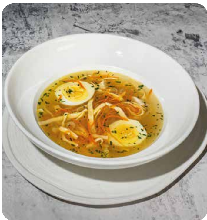
Куриный суп-лапша с яйцом 350 г 330 р