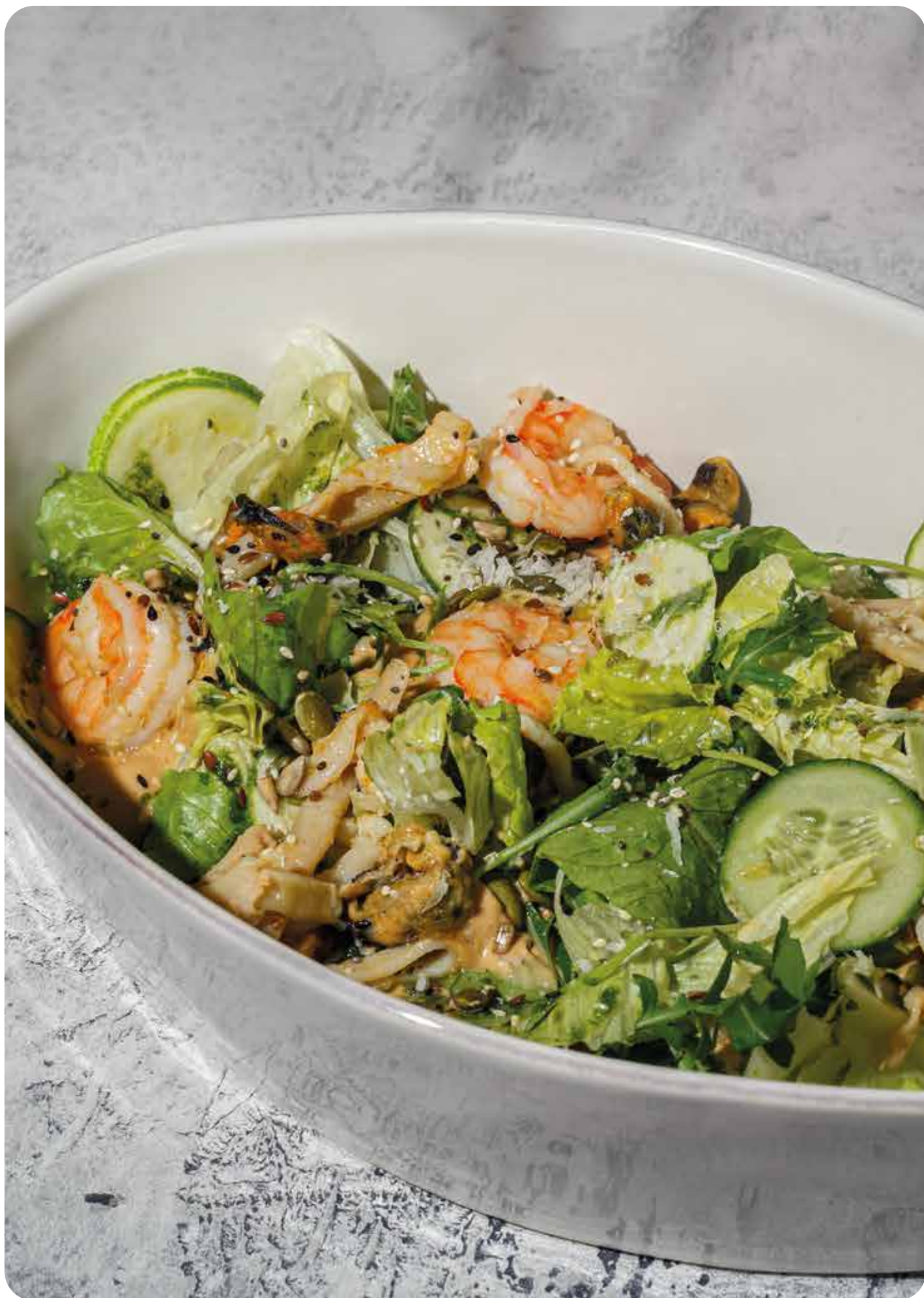
Гранде салат с морепродуктами ..... 370 г 1150 р

Если у вас есть аллергия на какой-либо ингредиент, пожалуйста, сообщите нам об этом заранее