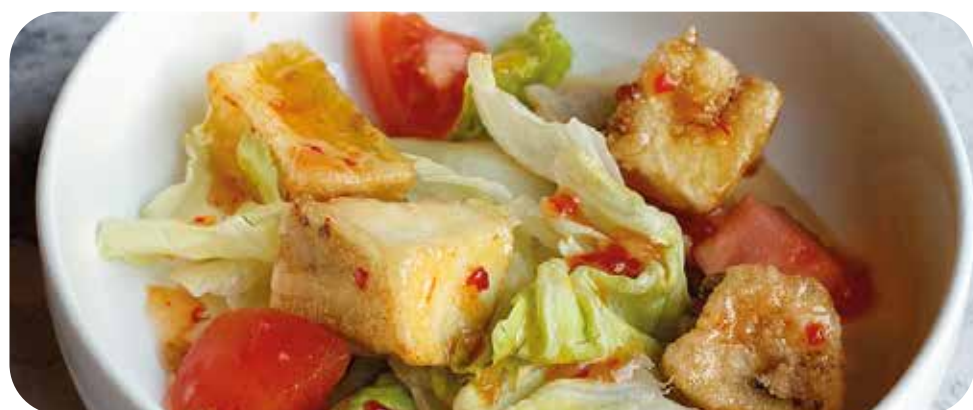
Салат с хрустящими баклажанами и томатами