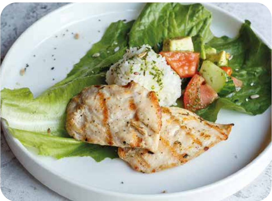
Куриное филе на гриле с японским рисом и овощным салатом