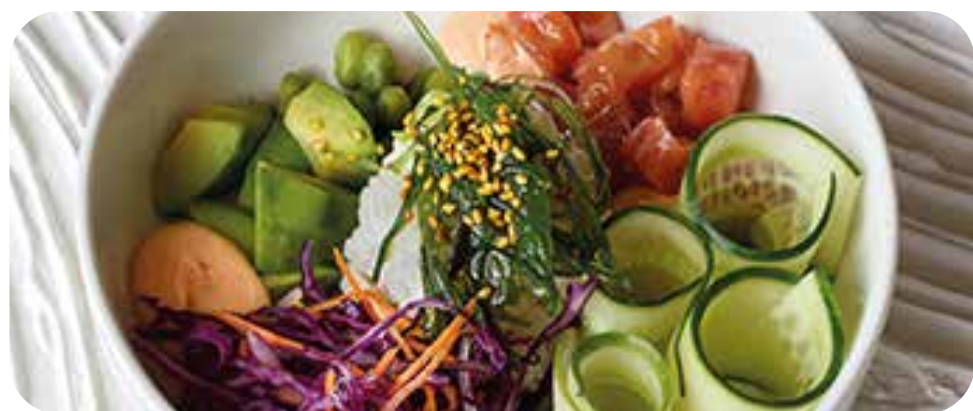
Поке с тунцом