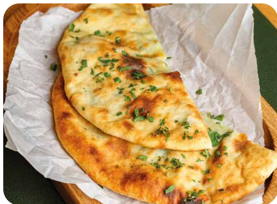
Осетинский пирог с сыром и зеленью