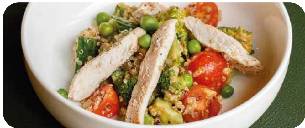
Салат с курицей, киноа и брокколи в устричной заправке