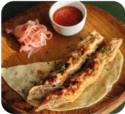
Люля-кебаб из курицы