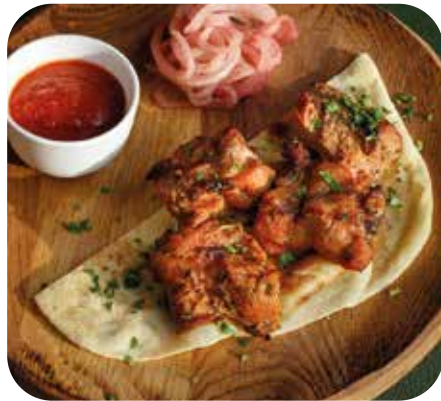
Шашлык из свиной шеи