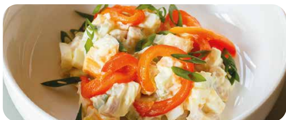
Салат с ветчиной и сыром