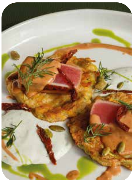
Оладьи из тыквы и кабачка с тунцом