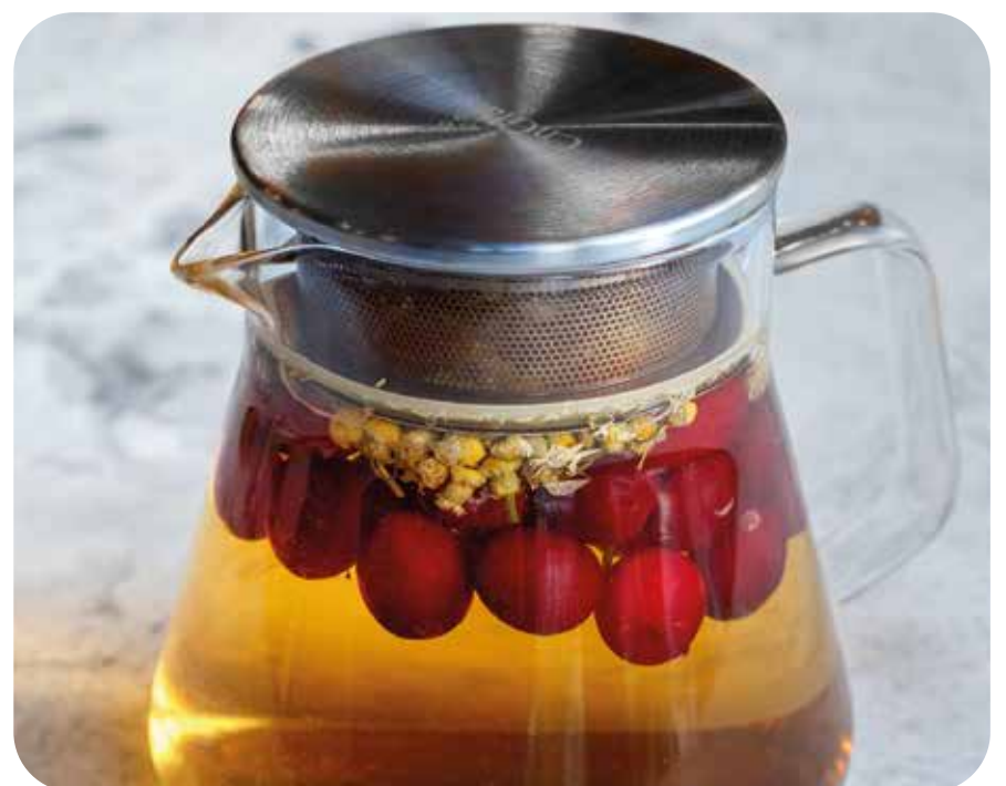
Чай ромашковый с бузиной и клюквой