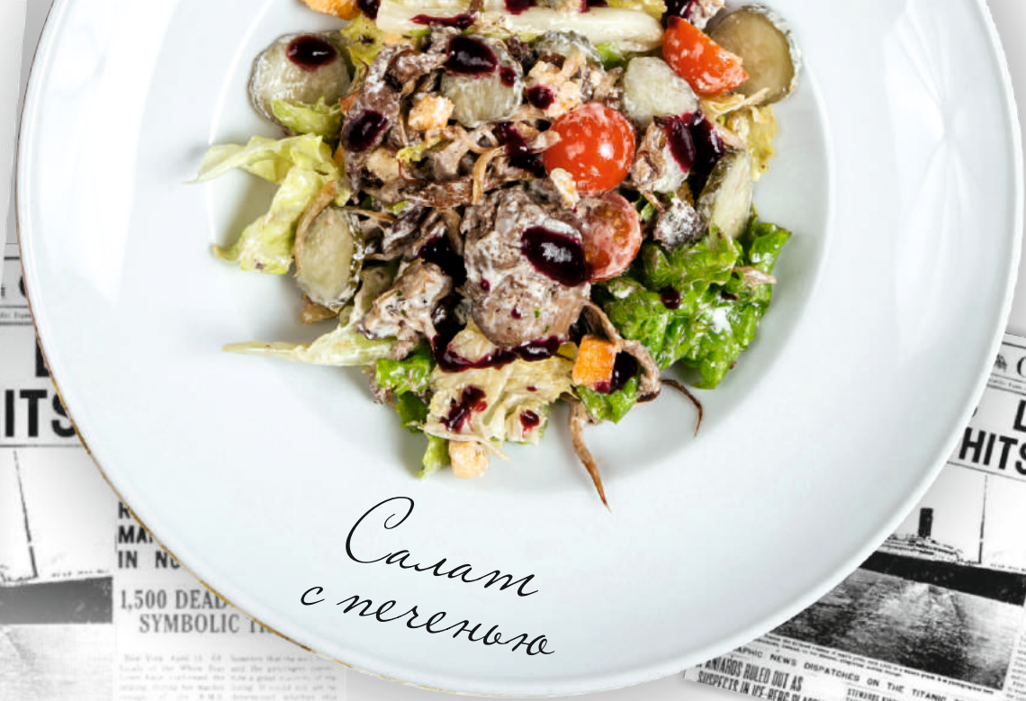
Салат с печенью