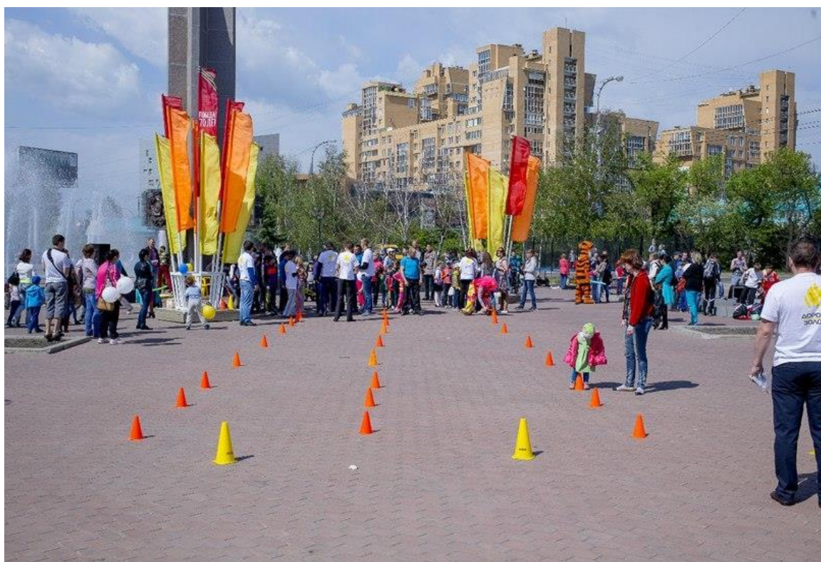
Первое мероприятие проведено на территории: парка «Звездочка», который расположен на остановке «Кинотеатр Баргузин».