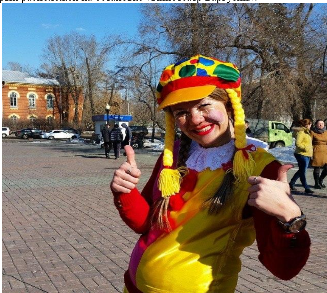
Второй городок проведен возле памятника Александру III.