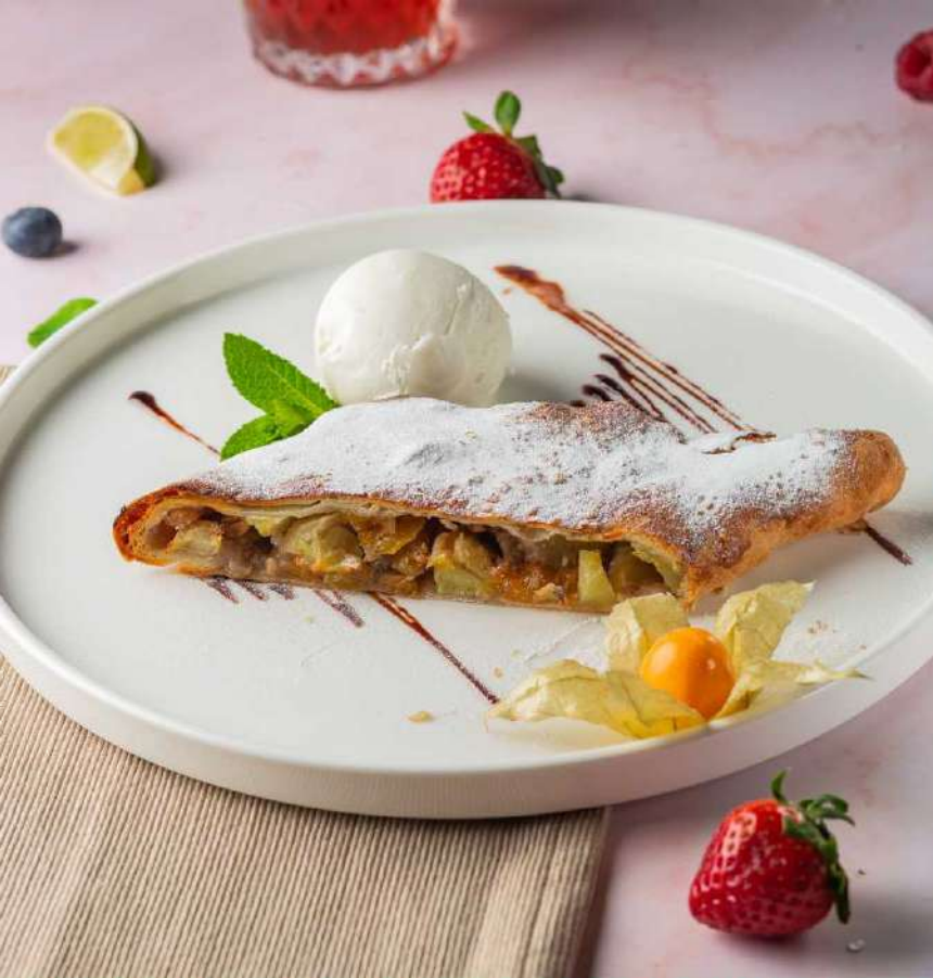
Штрудель Яблочный 295р