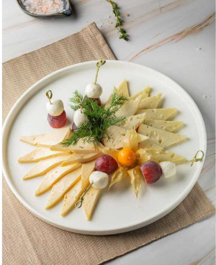
Ассорти сырное 355 р