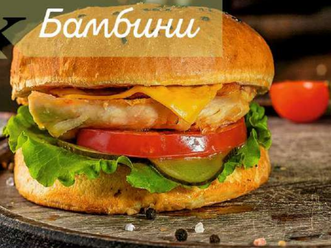
Чикен Бургер 315р