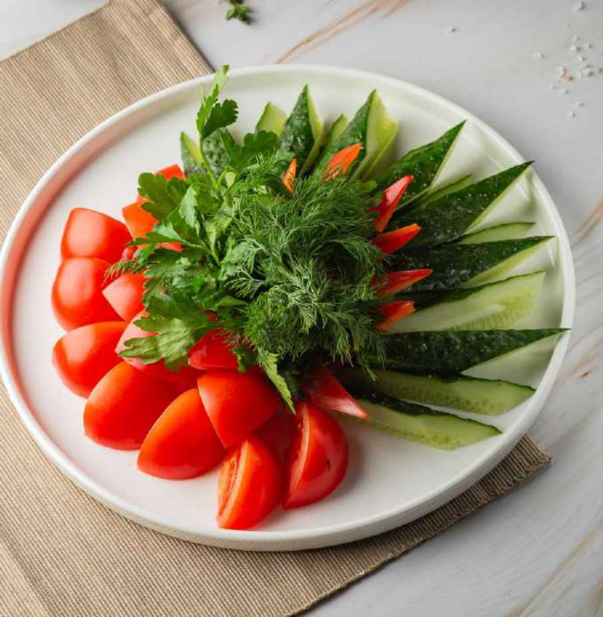
Ассорти овощное 355 р