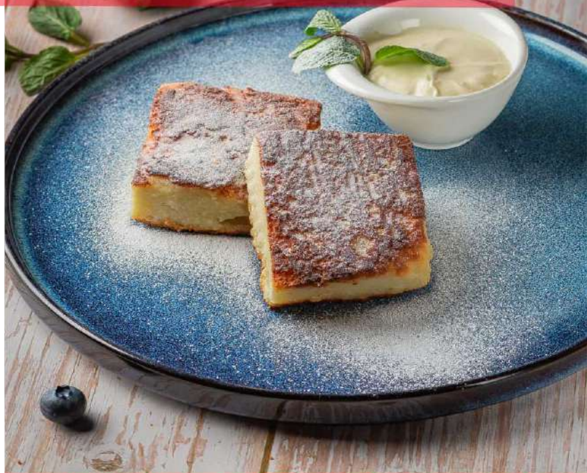
Запеканка КЛАССИЧЕСКАЯ 295р