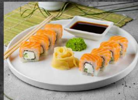
ФИЛАДЕЛЬФИЯ 435р ЛОСОСЬ, СЫР КРЕМЕТТО, ОГУРЕЦ