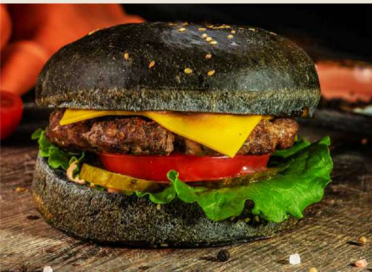
Бургер классический с говяжьей котлетой 325р (булочка на выбор – белая или черная)