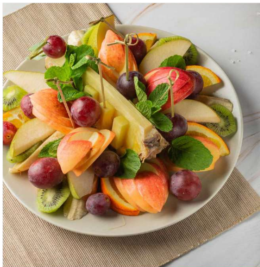
Фруктовая нарезка 695 р