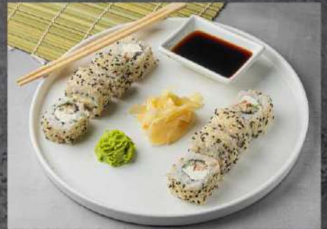
ФИЛАДЕЛЬФИЯ УНАГИ 435р УГОРЬ, СЛИВОЧНЫЙ СЫР, ОГУРЕЦ, КУНЖУТ