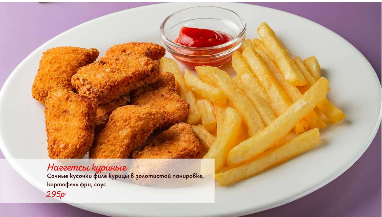
Наггетсы куриные Сочные кусочки филе курицы в золотистой панировке, картофель фри, соус 295р