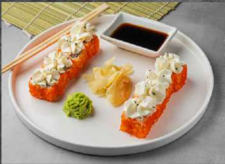
ШЕФ РОЛЛ 515р КРЕВЕТКА ТЕМПУРА, ТОБИКА СЛИВОЧНЫЙ СЫР, КУНЖУТ