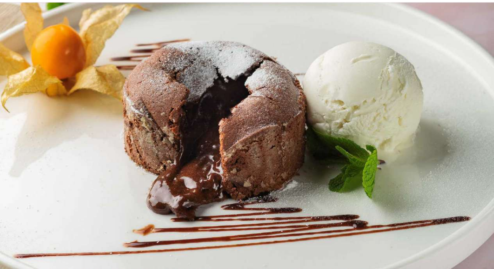
Фондан Шоколадный десерт С жидкой начинкой 335р