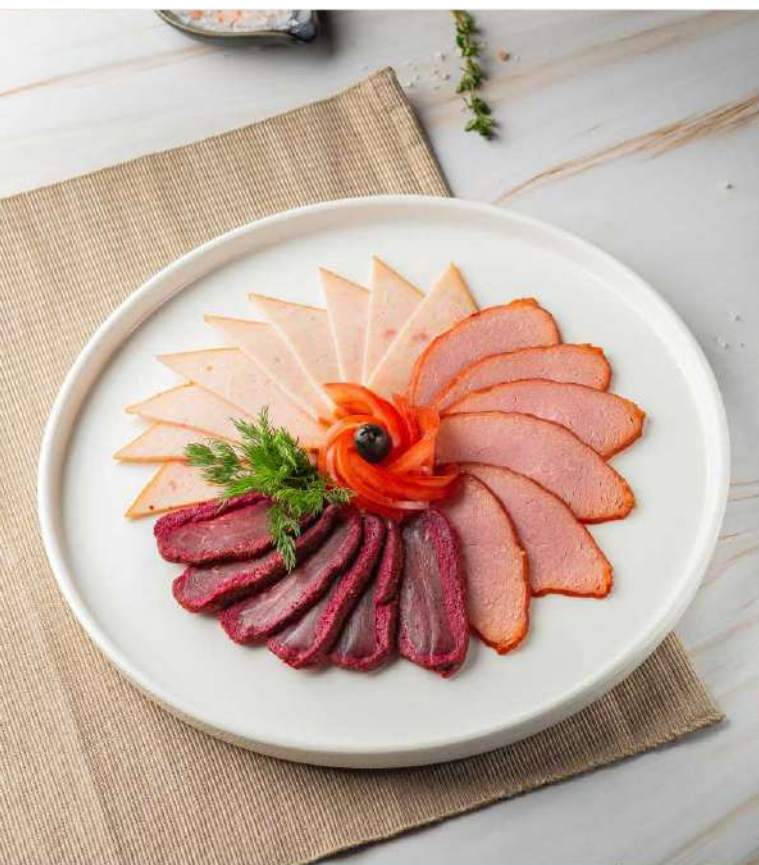
Ассорти мясное 555 р