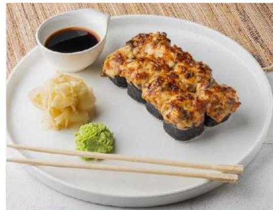
РИС ШИНАКИ, НОРИ, ОГУРЕЦ СОУС СПАЙСИ, ТЕМАКИ, ШАПКА ИЗ СНЕЖНОГО КРАБА.