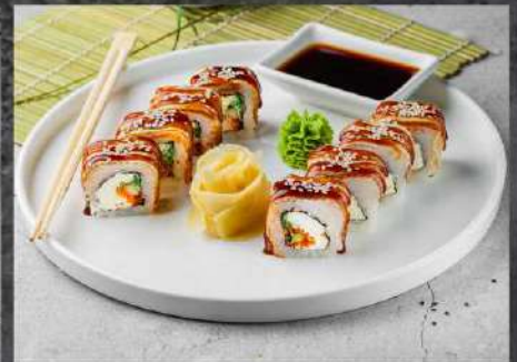
ДРАКОН 525р ЧУКА САЛАТ, СЫР КРЕМЕТТО, ИКРА ТОБИКО, ОГУРЕЦ, УГОРЬ