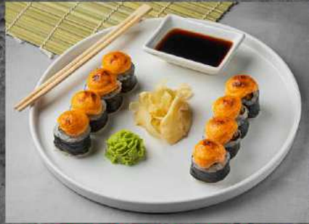
ЗАПЕЧЁНЫЙ С МИДИЯМИ 255р МИДИЯ, СНЕЖНЫЙ КРАБ, СОУС ЗАПЕЧЁННЫЙ