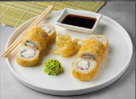
КАНЖИ ФРАЙ 255р СНЕЖНЫЙ КРАБ, СЛИВОЧНЫЙ СЫР, ОГУРЕЦ