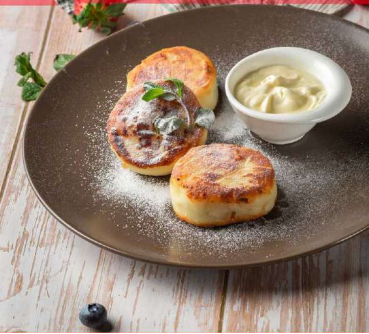
Сырники С СМЕТАНОЙ 295р

В ЗАЛЕ НА ВИТРИНЕ ВЫ МОЖЕТЕ ВЫБРАТЬ ЛЮБОЙ ИЗ 10 ДЕСЕРТОВ ДНЯ!