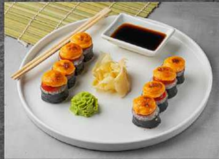
ЗАПЕЧЁНЫЙ ЧЕРРИ 315р КРЕВЕТКА ТЕМПУРА, ЧЕРРИ, СОУС ЗАПЕЧЁННЫЙ