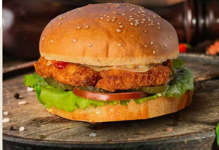
Бургер с куриными наггетсами и соусом тар-тар 315р