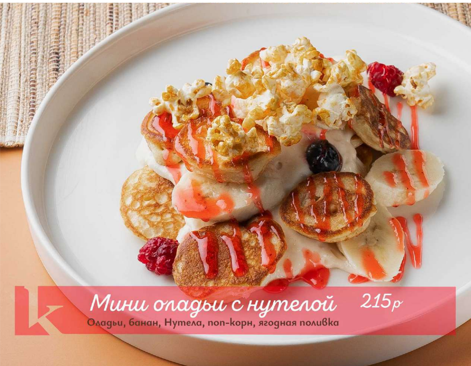
Мини оладьи с нутелой 215р Оладьи, банан, Нутела, поп-корн, ягодная поливка