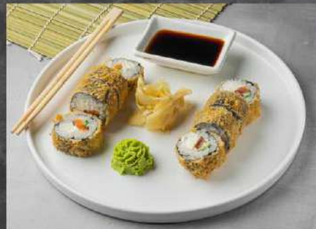
СЯКИ ФРАЙ 255р СЕМГА, ОГУРЕЦ, СЛИВОЧНЫЙ СЫР, СПАЙС СОУС