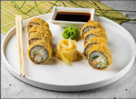
ЗЕБИ ТЕМПУРА 415р КРЕВЕТКИ ТИГРОВЫЕ, ОГУРЕЦ, СЫР КРЕМЕТТО, ЗЕЛЕНЬ