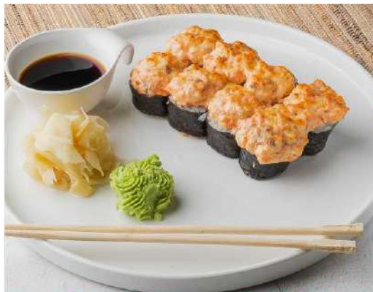
РИС ШИНАКИ, НОРИ, ОГУРЕЦ СОУС СПАЙСИ, ТЕМАКИ, ШАПКА ИЗ ЛОСОСЯ.