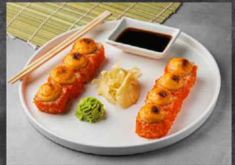
ФУДЗИЯМА 475р УГОРЬ, СНЕЖНЫЙ КРАБ, ОГУРЕЦ, СЛИВОЧНЫЙ СЫР, СОУС ЗАПЕЧЁННЫЙ