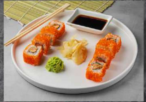
СЯКИ ТЕРИЯКИ 475р ЖАРЕННЫЙ ЛОСОСЬ, СОУС СПАЙС, ОГУРЕЦ, ТОБИКА