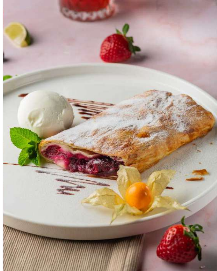
Штрудель Вишневый 295р