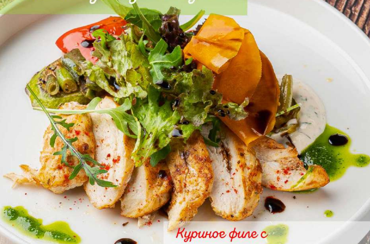
Куриное филе с с овощами гриль и микс-салатом 395р