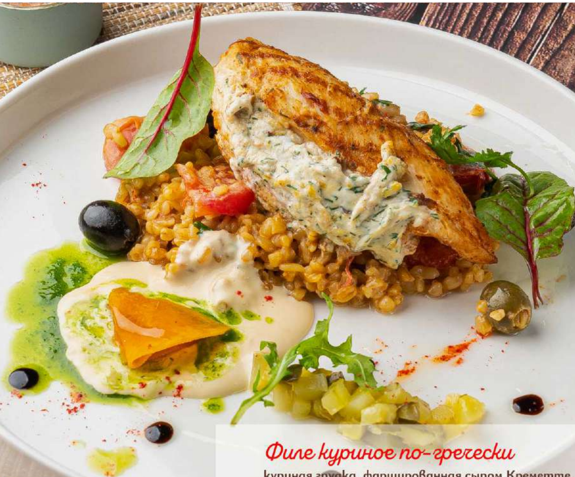
Филе куриное по-гречески куриная грудка, фаршированная сыром Крeмeттe, со сливочным булгуром, солеными огуpцaми и маслинами 420р