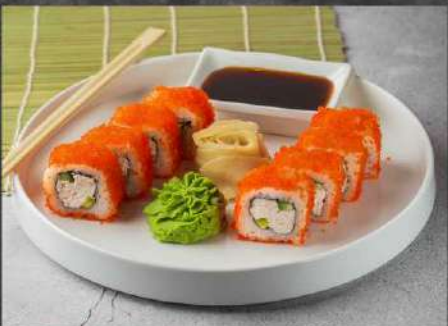
КАЛИФОРНИЯ 315р СНЕЖНЫЙ КРАБ, ОГУРЕЦ, АВОКАДО, ИКРА ТОБИКО